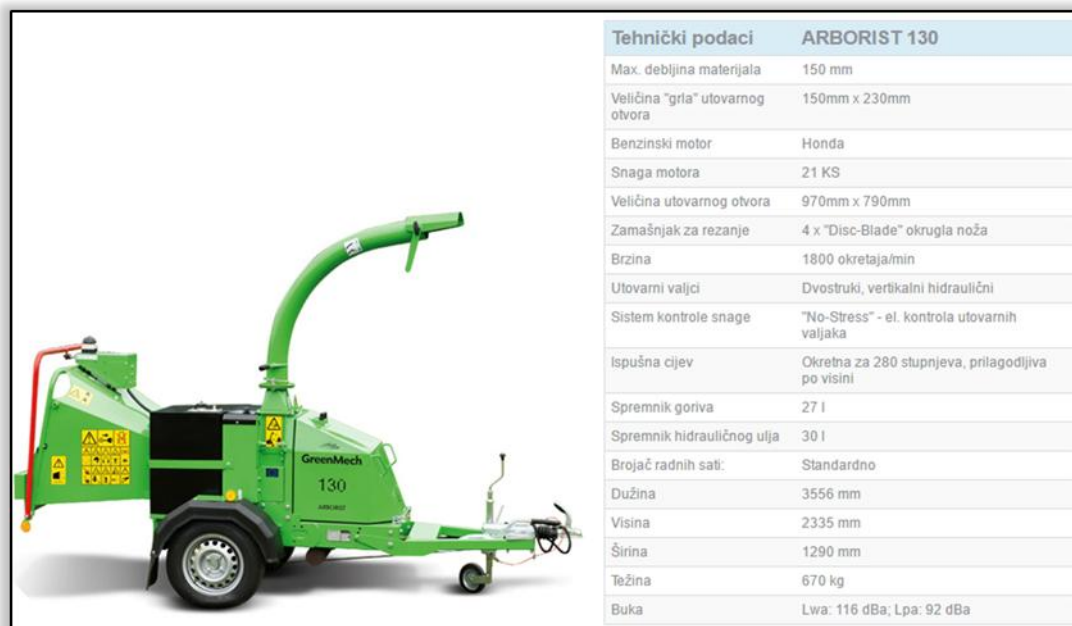
Slika 1. Sjekač drvene mase GreenMech Arborist 130 (MAGUS STROJ d.o.o.)

Mobilno reciklažno dvorište nabavljeno je od tvrtke Tehnix d.o.o. uz sufinanciranje Fonda za zaštitu okoliša i energetska učinkovitost u iznosu od 40%, odnosno 38.800,00 kn. Nabavna cijena mobilnog reciklažnog dvorišta iznosila je cijena 97.000,00 kn (bez PDV-a). Dimenzije mobilnog reciklažnog dvorišta (tip P-7) iznose 4000 x 1800 x 2250 mm te sadrže spremnike za sakupljanje sljedećih vrsta otpada: