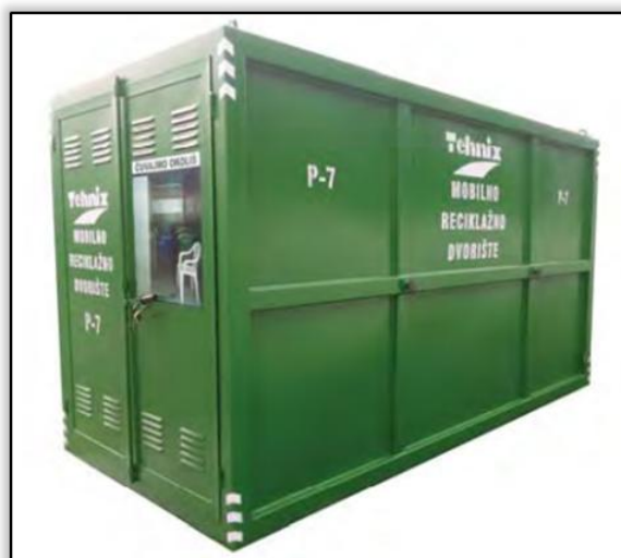
Slika 2. Mobilno reciklažno dvorište P-7 (Tehnix d.o.o)

Mobilno reciklažno dvorište izrađeno je u skladu sa zakonskom regulativom te atestirano od ovlaštene institucije.