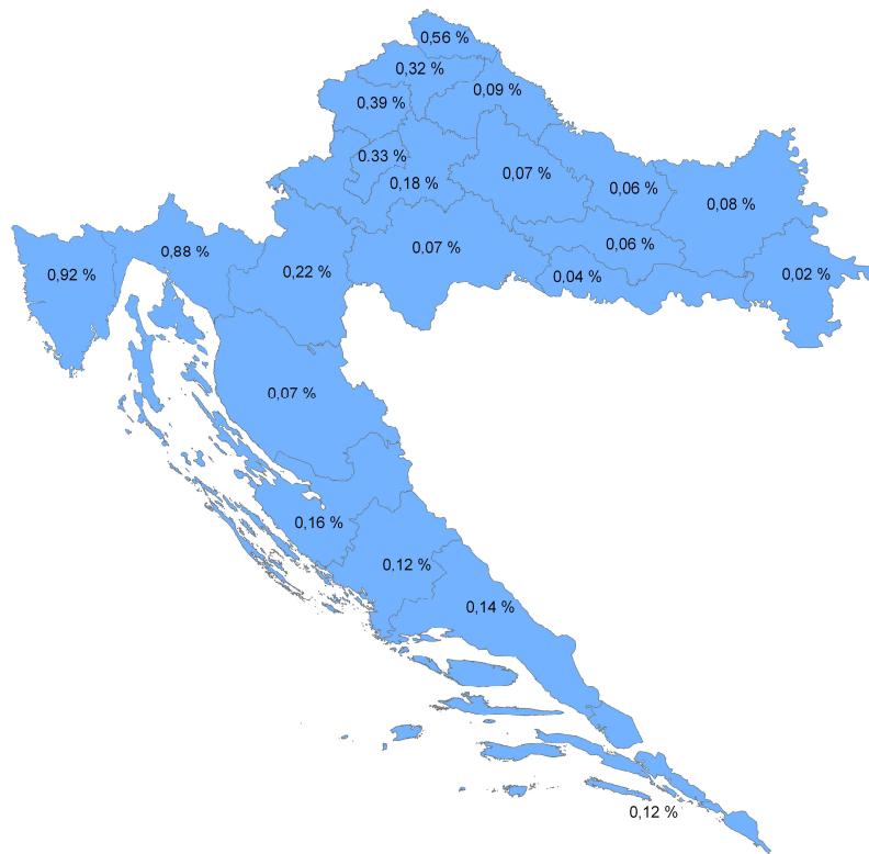
Slika 1 – Postotak govornika kojima je slovenski materinski jezik u odnosu na ostatak stanovništva po županijama