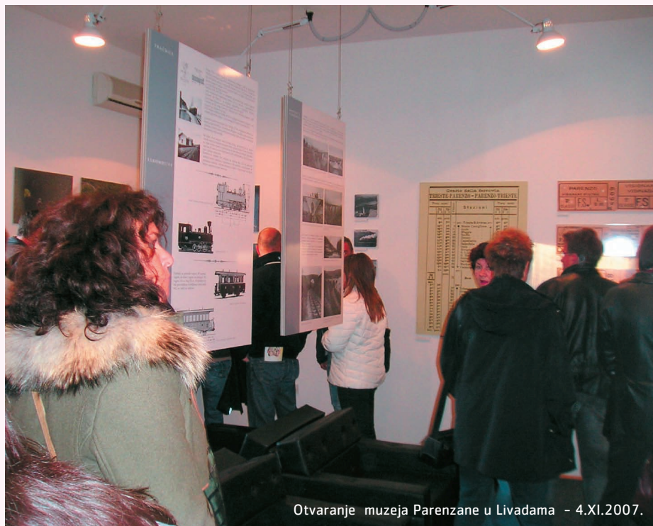
Otvaranje muzeja Parenzane u Livadama - 4.XI.2007.

• DOGADAJI : otvaranje malog muzeja Parenzane u Livadama (04/11/2007) kada Maraton klub iz Umaga organizira duatlon po Parenzani; re-