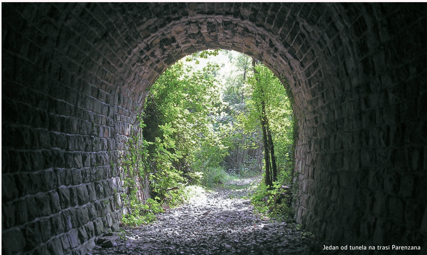
Jedan od tunela na trasi Parenzana

zila željeznica, na kojem će se pritiskom na gumb npr. tuneli, postaje, vijadukti osvjeteliti predmetna područja. U muzeju će posjetitelji moći uzeti i sav promotivni materijal koji je izrađen u okviru ovog projekta. Muzej neće biti stalno otvoren već će se uz najavu u Istarskoj županiji ili Općini Oprtalj moći ući...škole, ekskurzije, grupe, radionice.