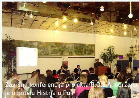
Završna konferencija projekta R.O.S.A. održana je u hotelu Histria u Puli

na istočnom Jadranu" koja daje pregled sajmenih aktivnosti na hrvatskoj i crnogorskoj strani Jadrana te prijedlog modela organizacije zajedničkog sajma. Studiju je izradilo Sveučilište Jurja Dobrile uz koordinaciju Istarske županije.