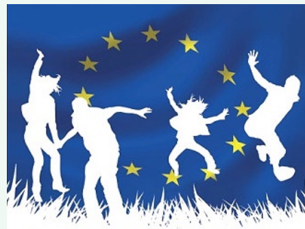
Servizio Volontario Europeo

Agencija Lokalne Demokracije (ALD) Brtonigla-Veršeneglio prošla je završnu fazu europske evaluacije i uspješno dobila akreditaciju za Europsku volontersku službu (EVS) te će tijekom Europskog tjedna Mladih, od 2. do 9.11. 2008. godine, organizirati niz aktivnosti za mlade u školama, na raznim lokacijama Istarske županije te u svom sjedištu u Brtonigli.