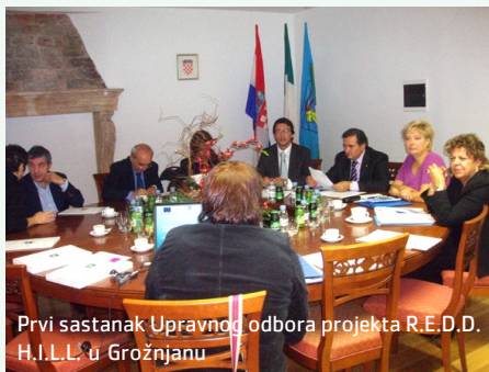
Prvi sastanak Upravnog odbora projekta R.E.D.D. H.I.L.L. u Grožnjanu

U Grožnjanu su se 02. listopada susreli predstavnici Istarske županije, talijanskih regija Abruzzo, Puglia i Veneto, Općine Grožnjan te Agencije lokalne demokracije iz Brtonigle-partneri na projektu R.E.D.D. H.I.L.L. (Rural and Economic Development of a Disadvantaged Historical Istrian Locality). U sklopu županijskih smjernica revitalizacije rural-