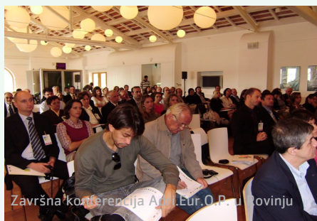
Završna konferencija Adri.Eur.O.P. u Rovinju