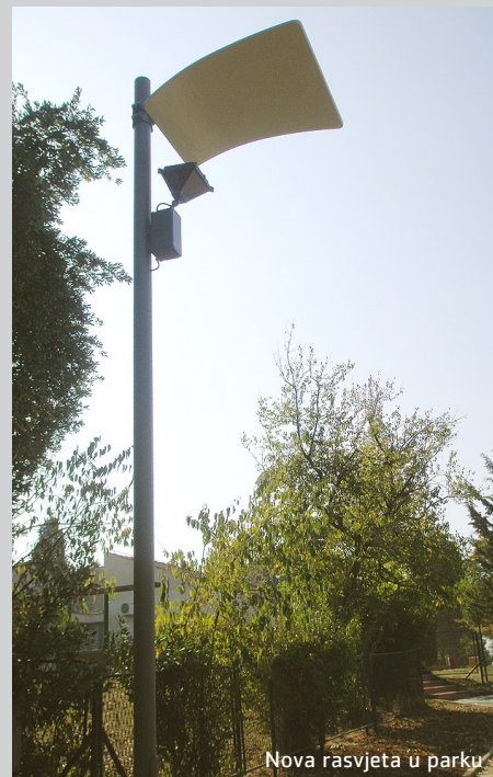
Nova rasvjeta u parku

Grad Pula nastavlja s radovima u parku Monte Zaro s vlastitim sredstvima. Planirani radovi trebali bi započeti u roku sljedećih mjesec dana, a obuhvaćat će obnovu i rekonstrukciju staza i oborinske odvodnje, te elektro-rekonstrukciju.