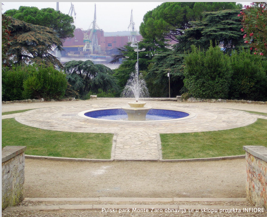
Pulski park Monte Zaro obnavlja se u sklopu projekta INFIORE