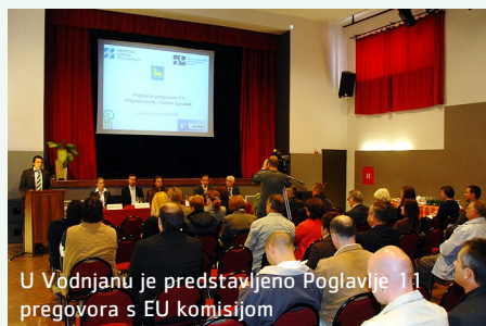
U Vodnjanu je predstavljeno Poglavlje 11 pregovora s EU komisijom

Istarska županija u suradnji s Hrvatskom udrugom poslodavaca i Ministarstvom poljoprivrede, ribarstva i ruralnog razvoja 24. listopada predstavila je u Vodnjanu Poglavlje 11 pregovora s EU komisijom-Poljoprivreda i ruralni razvitak. Cilj je bio informirati istarske poljoprivrednike, prerađivače i ribare o uvjetima koje ih očekuju s ulaskom Hrvatske u Europsku uniju.