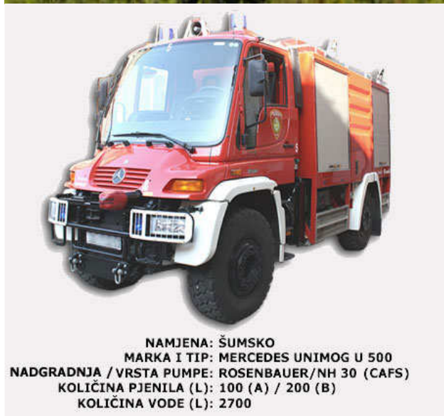
NAMJENA: ŠUMSKO MARKA I TIP: MERCEDES UNIMOG U 500 NADGRADNJA / VRSTA PUMPE: ROSENBAUER/NH 30 (CAFS) KOLIČINA PJENILA (L): 100 (A) / 200 (B) KOLIČINA VODE (L): 2700