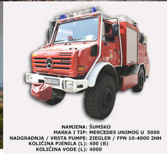
NAMJENA: ŠUMSKO MARKA I TIP: MERCEDES UNIMOG U 5000 NADGRADNJA / VRSTA PUMPE: ZIEGLER / FPN 10-4000 2HH KOLIČINA PJENILA (L): 400 (B) KOLIČINA VODE (L): 4000