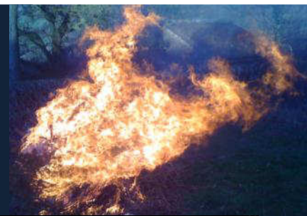
Intervencije JVP Pula od 1996-2011