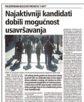
Glas Istre, 25.04.2012.