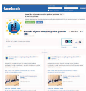
Facebook: Hrvatska alijansa evropske godine građana