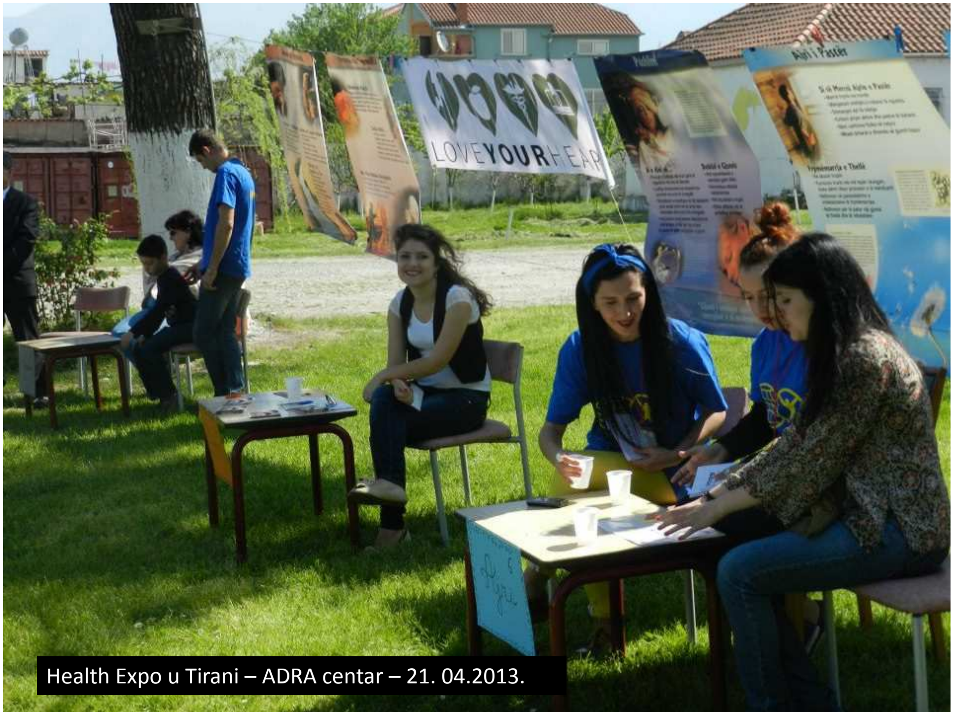
Health Expo u Tirani – ADRA centar – 21. 04.2013.