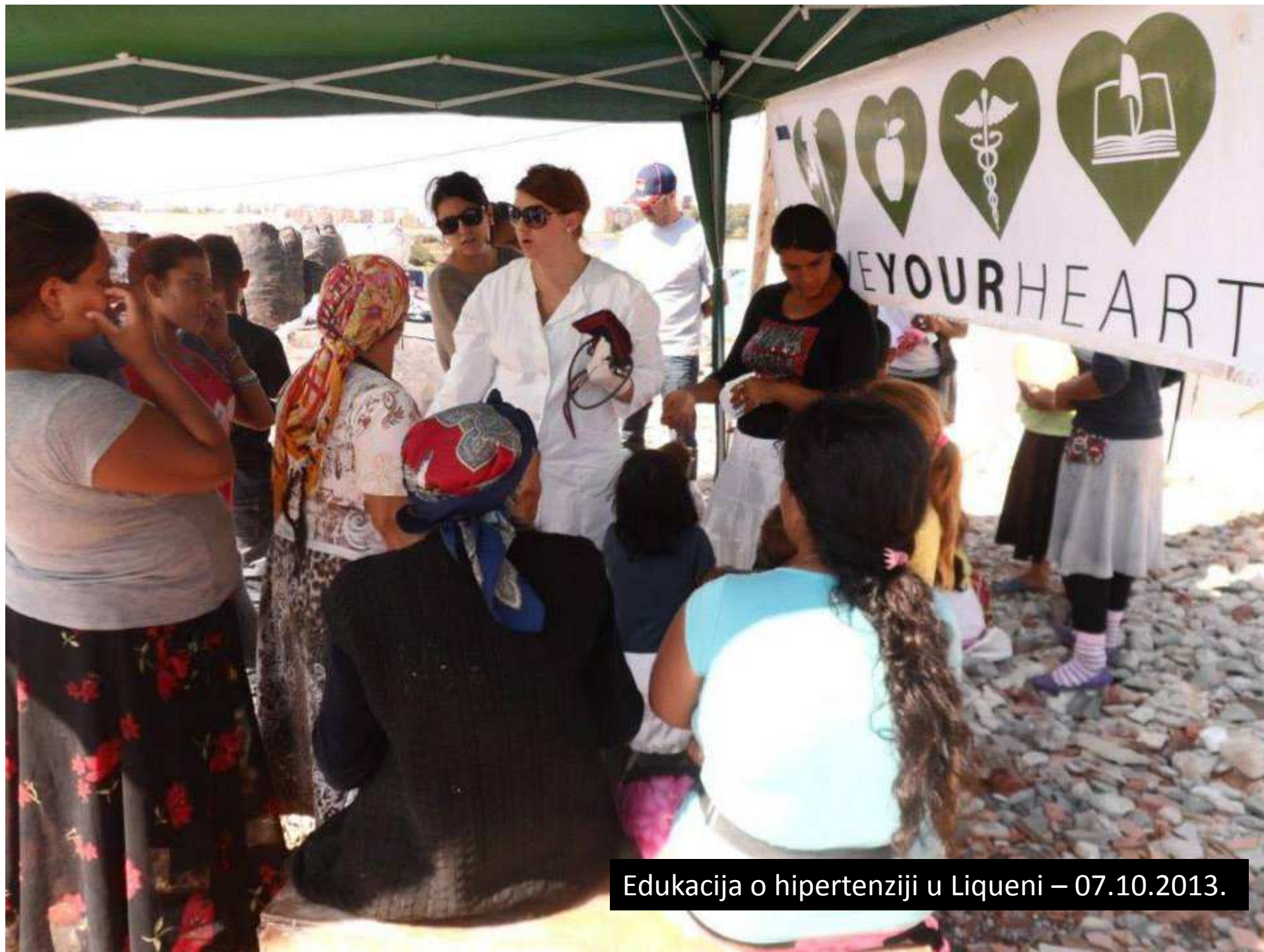
Edukacija o hipertenziji u Liqueni – 07.10.2013.