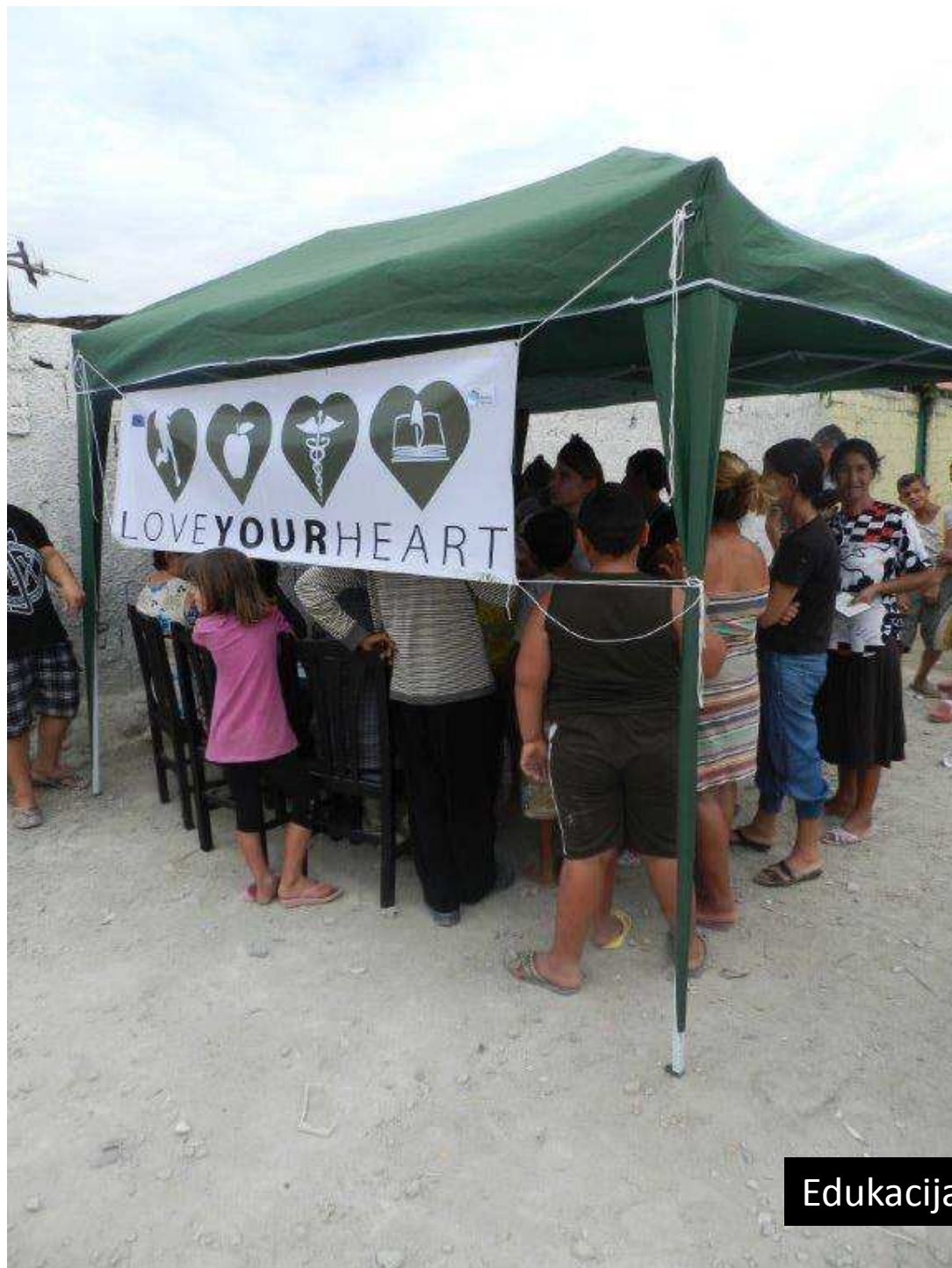
Edukacija u Bregu i Lunitu– 09.09.2013.