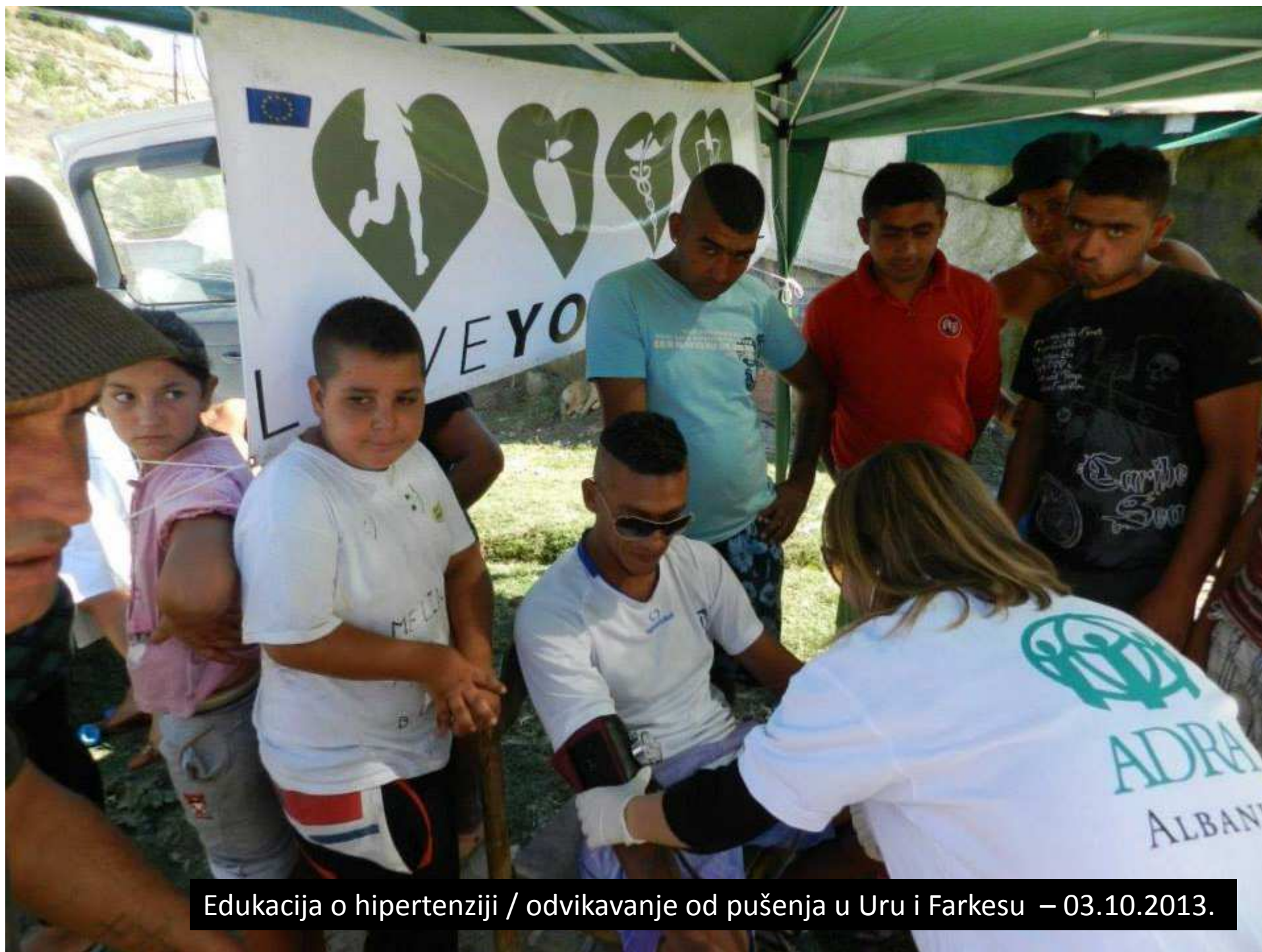
Edukacija o hipertenziji / odvikavanje od pušenja u Uru i Farkesu – 03.10.2013.