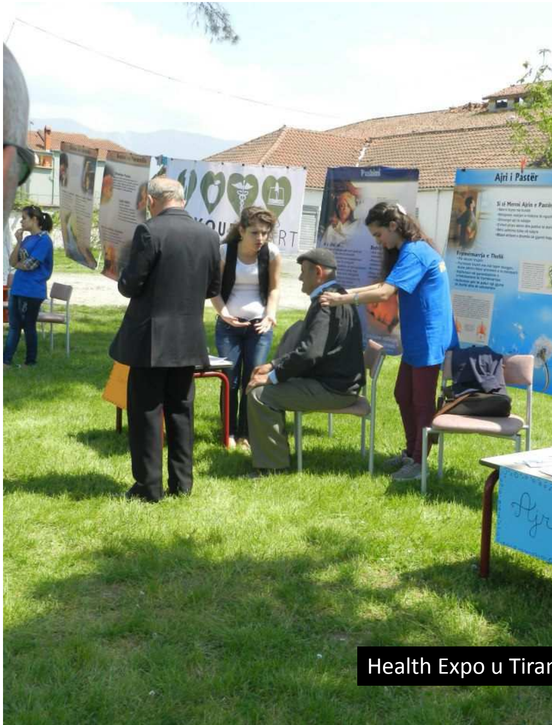
Health Expo u Tirani – ADRA centar – 21. 04.2013.