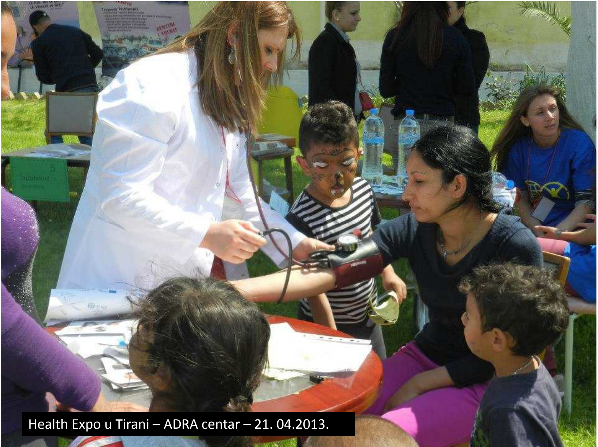
Health Expo u Tirani – ADRA centar – 21. 04.2013.