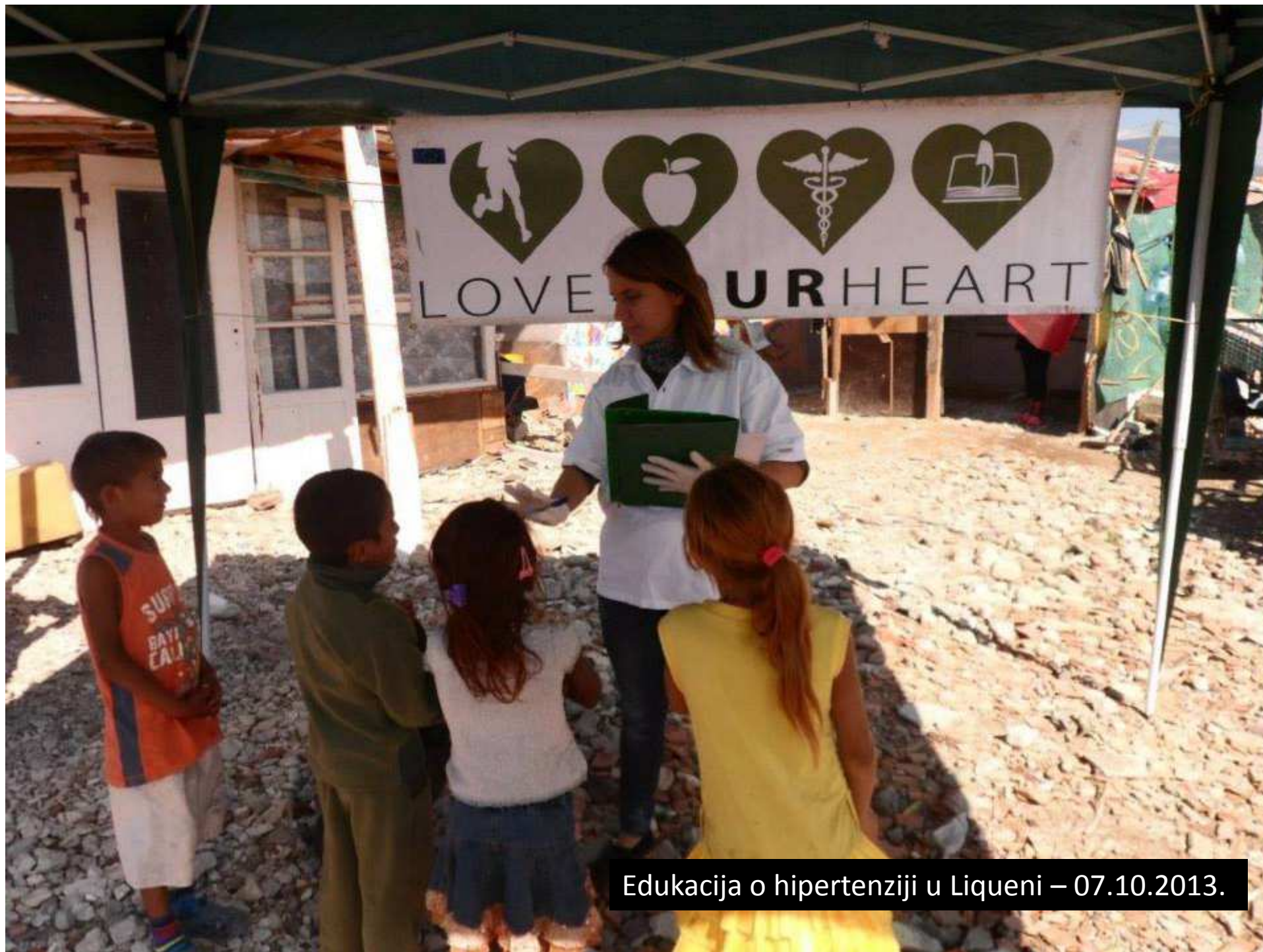
Edukacija o hipertenziji u Liqueni – 07.10.2013.