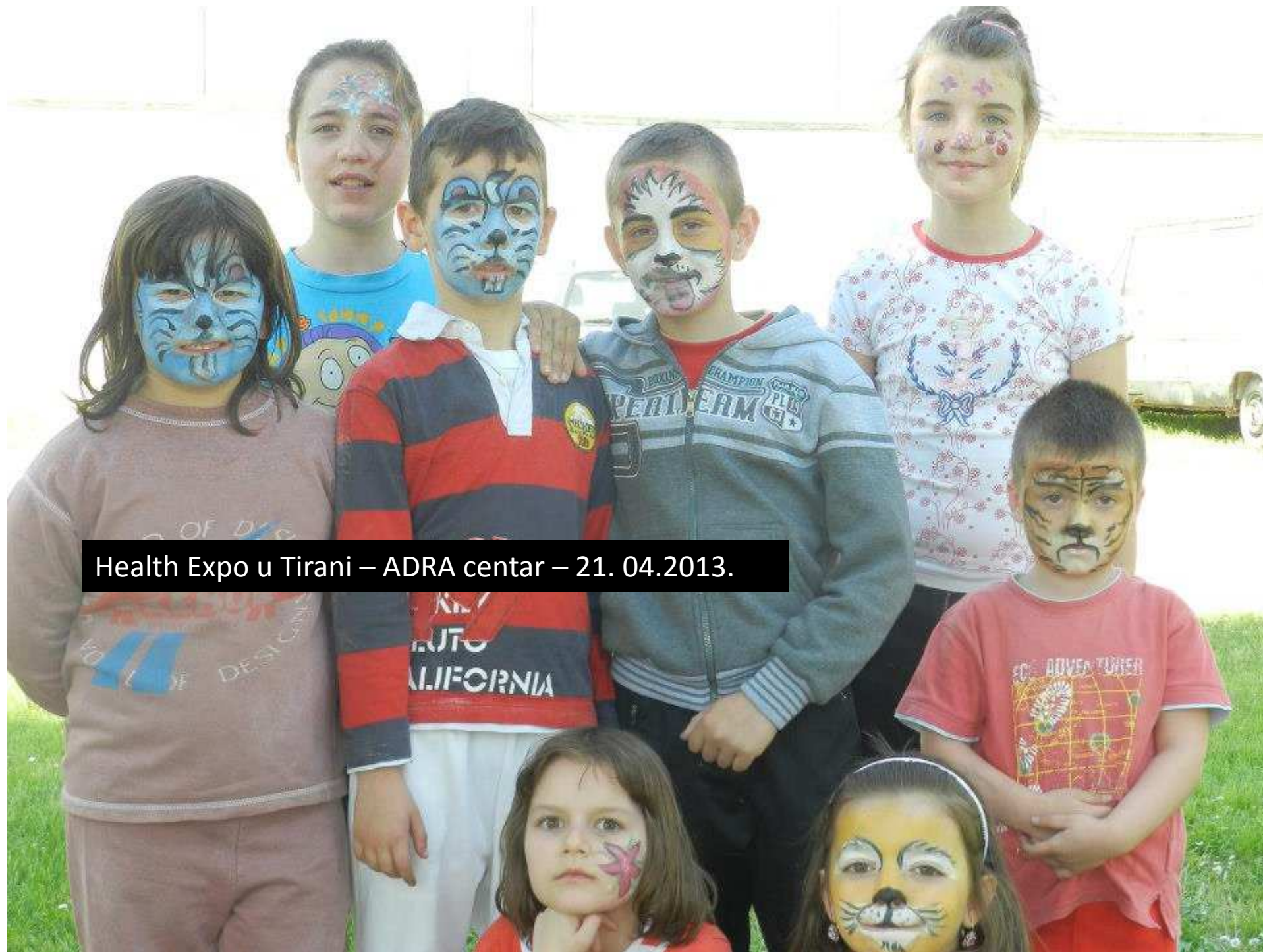
Health Expo u Tirani – ADRA centar – 21. 04.2013.