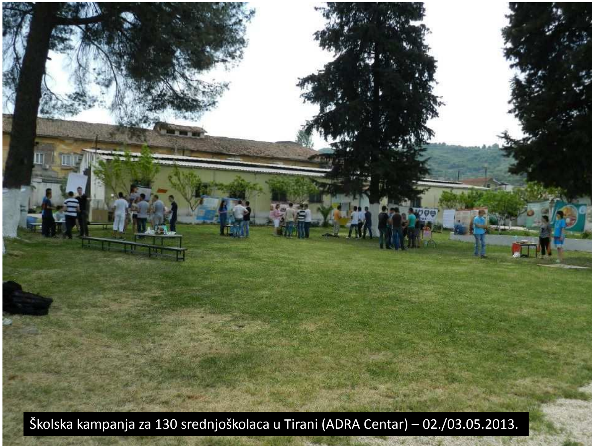
Školska kampanja za 130 srednjoškolaca u Tirani (ADRA Centar) – 02./03.05.2013.