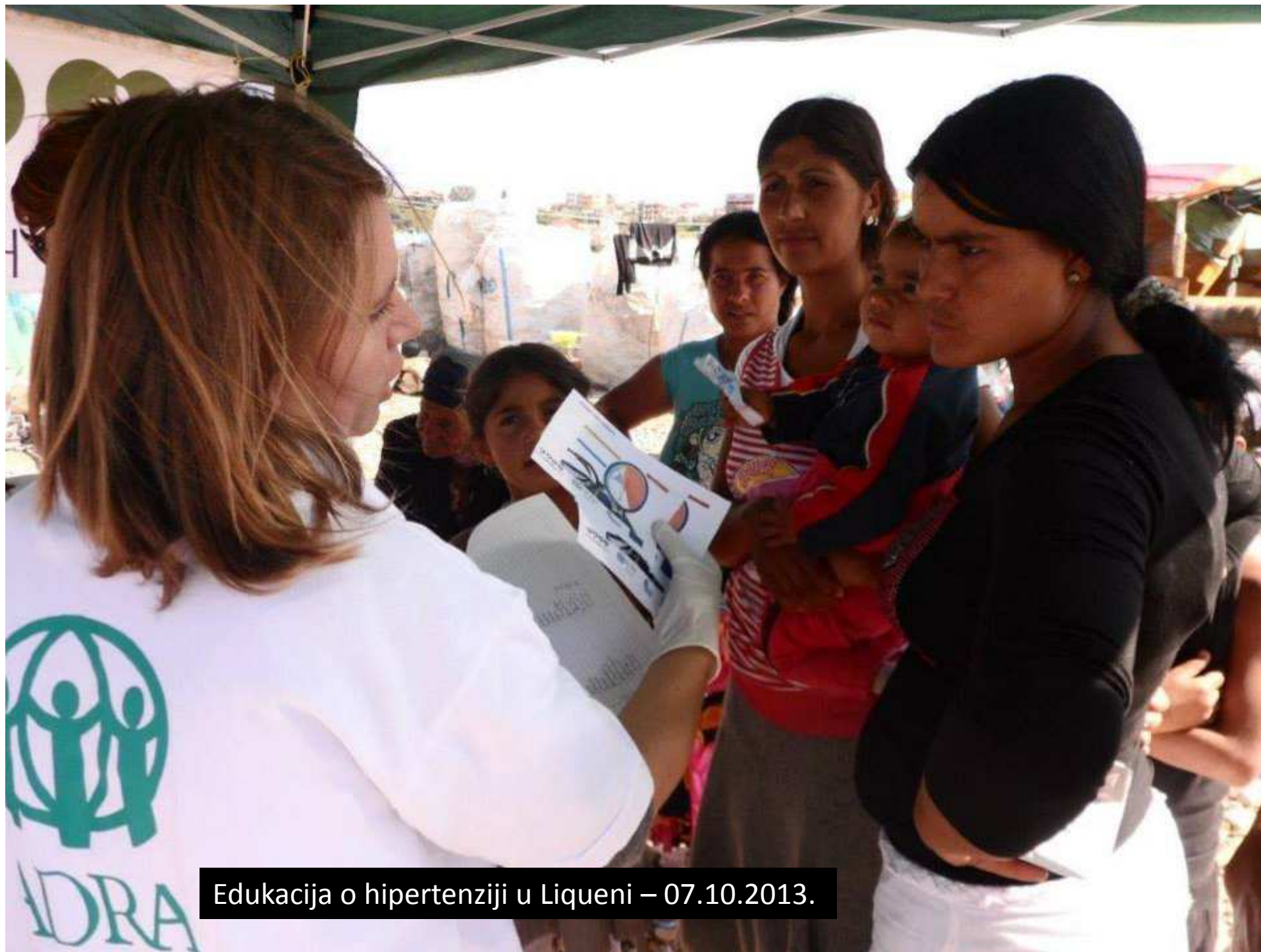
Edukacija o hipertenziji u Liqueni – 07.10.2013.