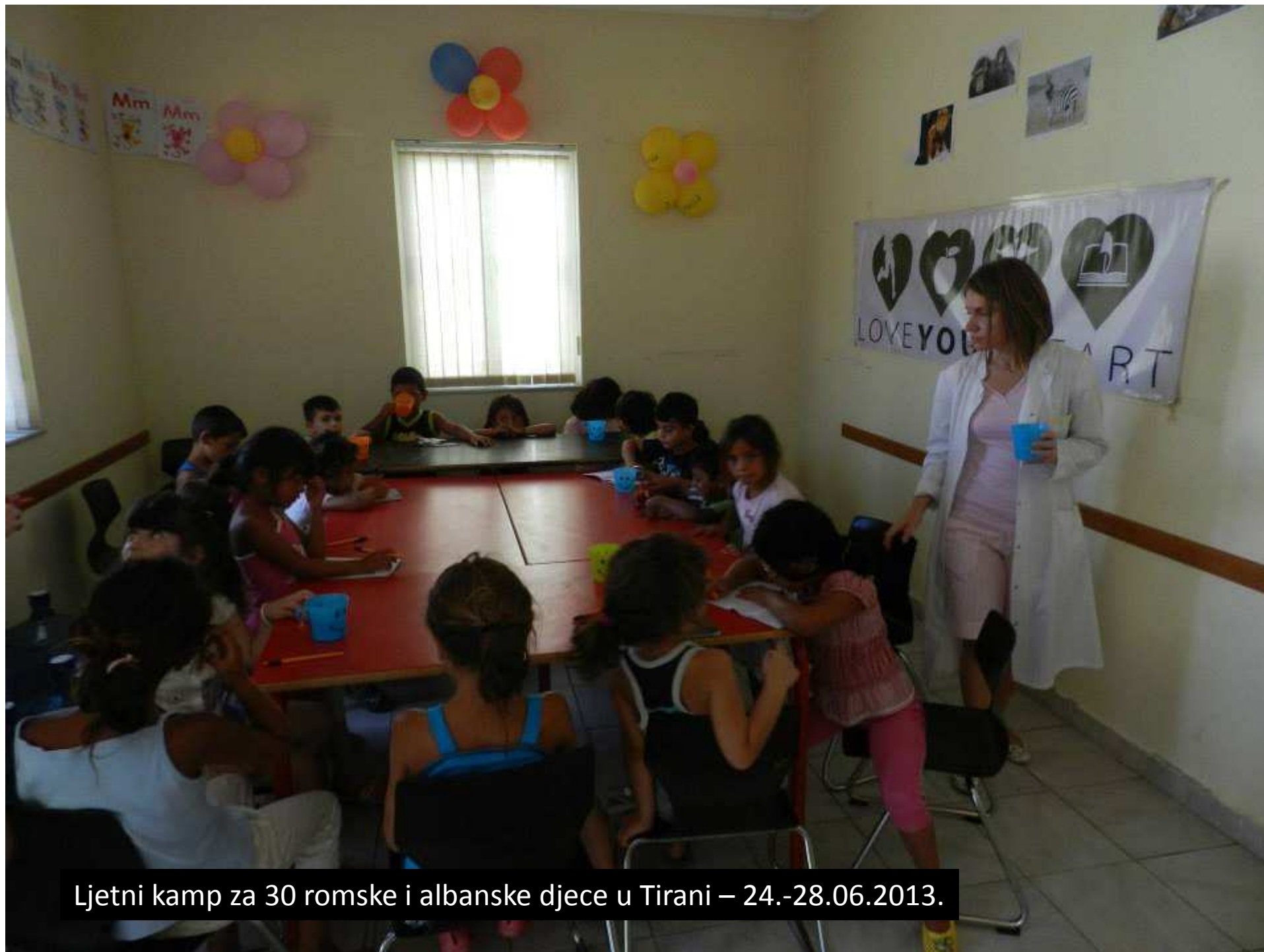
Ljetni kamp za 30 romske i albanske djece u Tirani – 24.-28.06.2013.