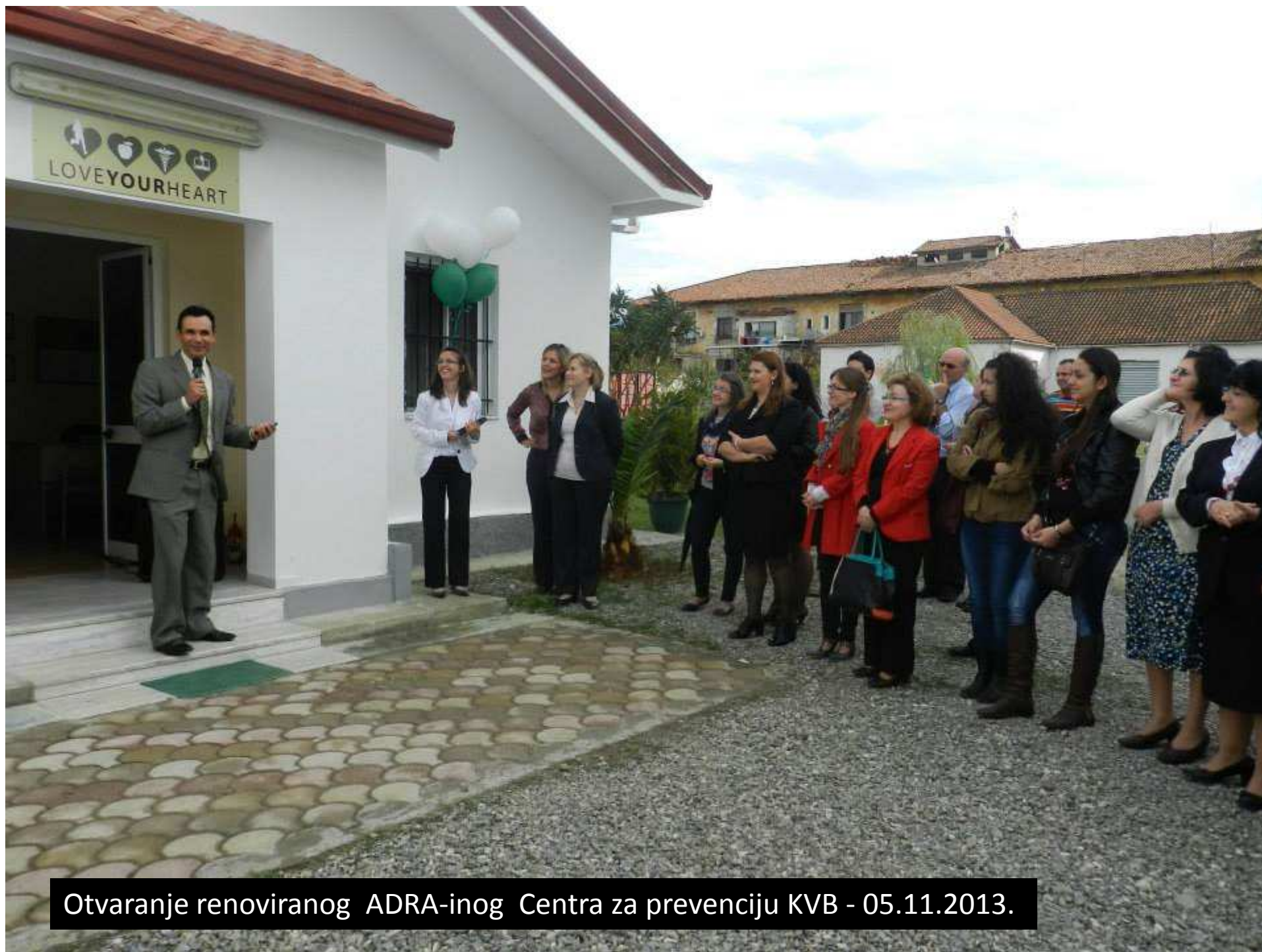
Otvaranje renoviranog ADRA-inog Centra za prevenciju KVB - 05.11.2013.