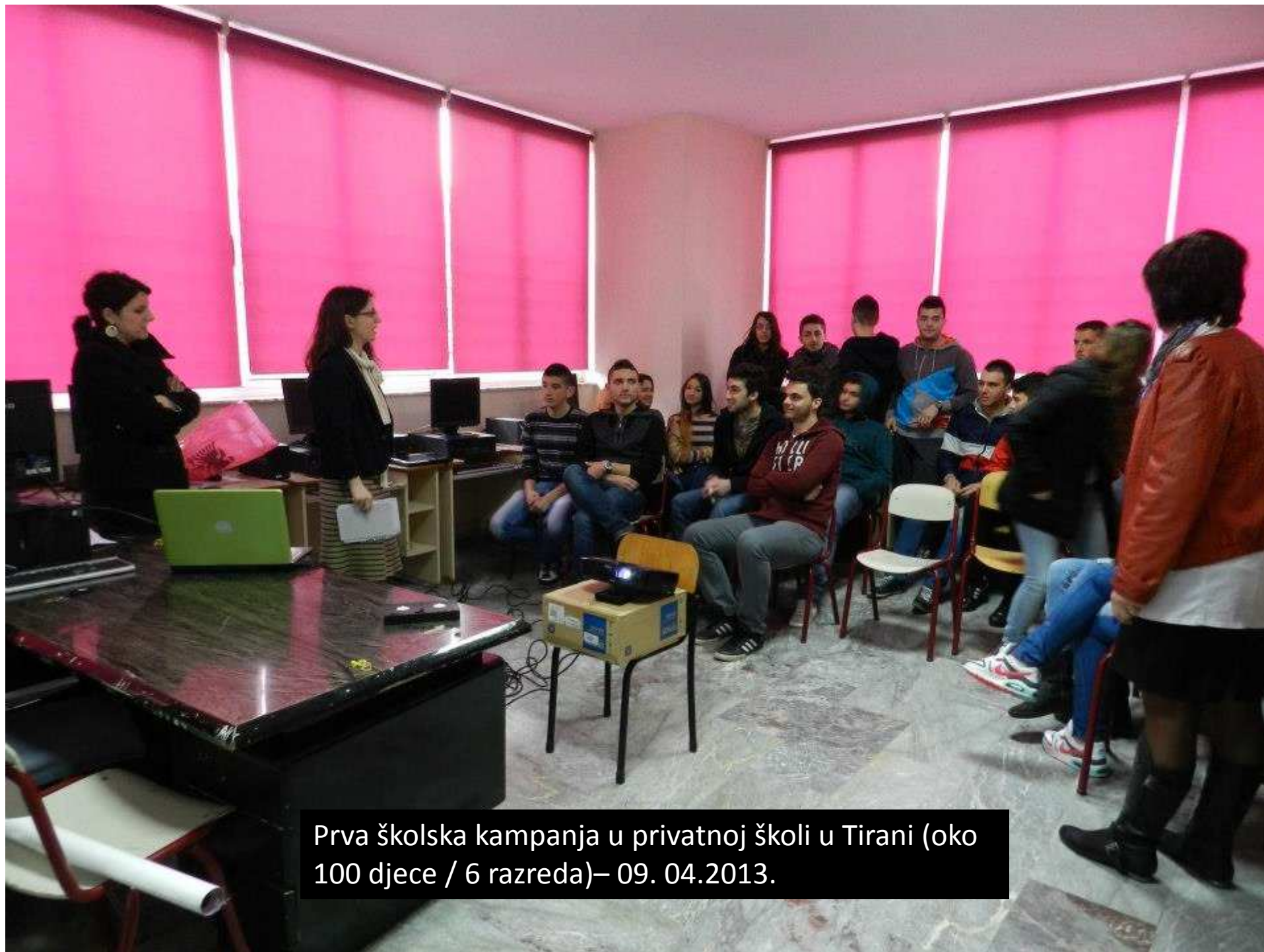
Prva školska kampanja u privatnoj školi u Tirani (oko 100 djece / 6 razreda)– 09. 04.2013.