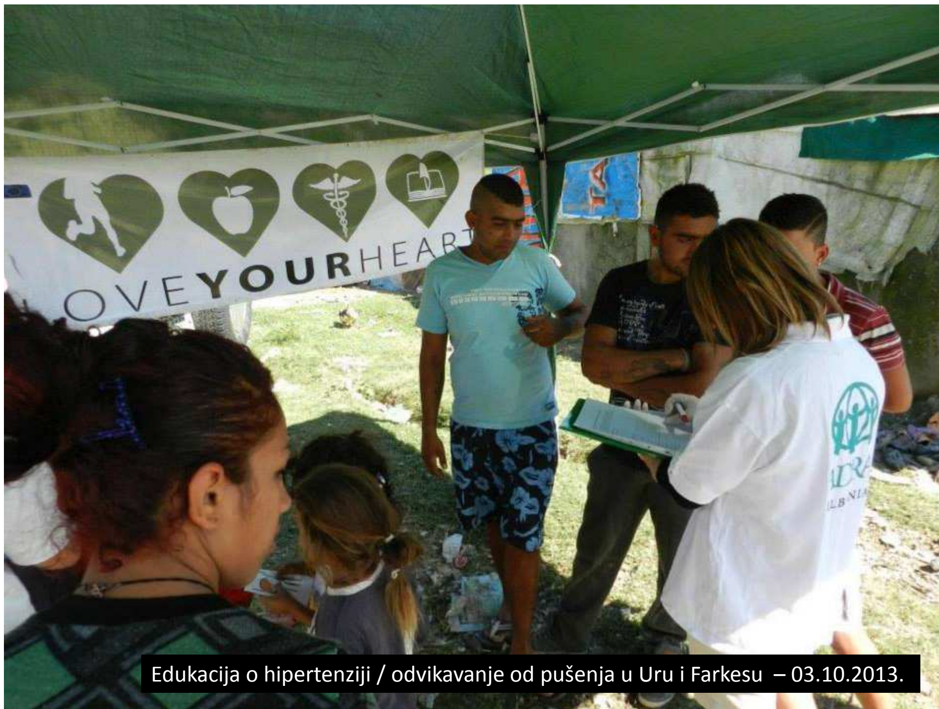
Edukacija o hipertenziji / odvikavanje od pušenja u Uru i Farkesu – 03.10.2013.