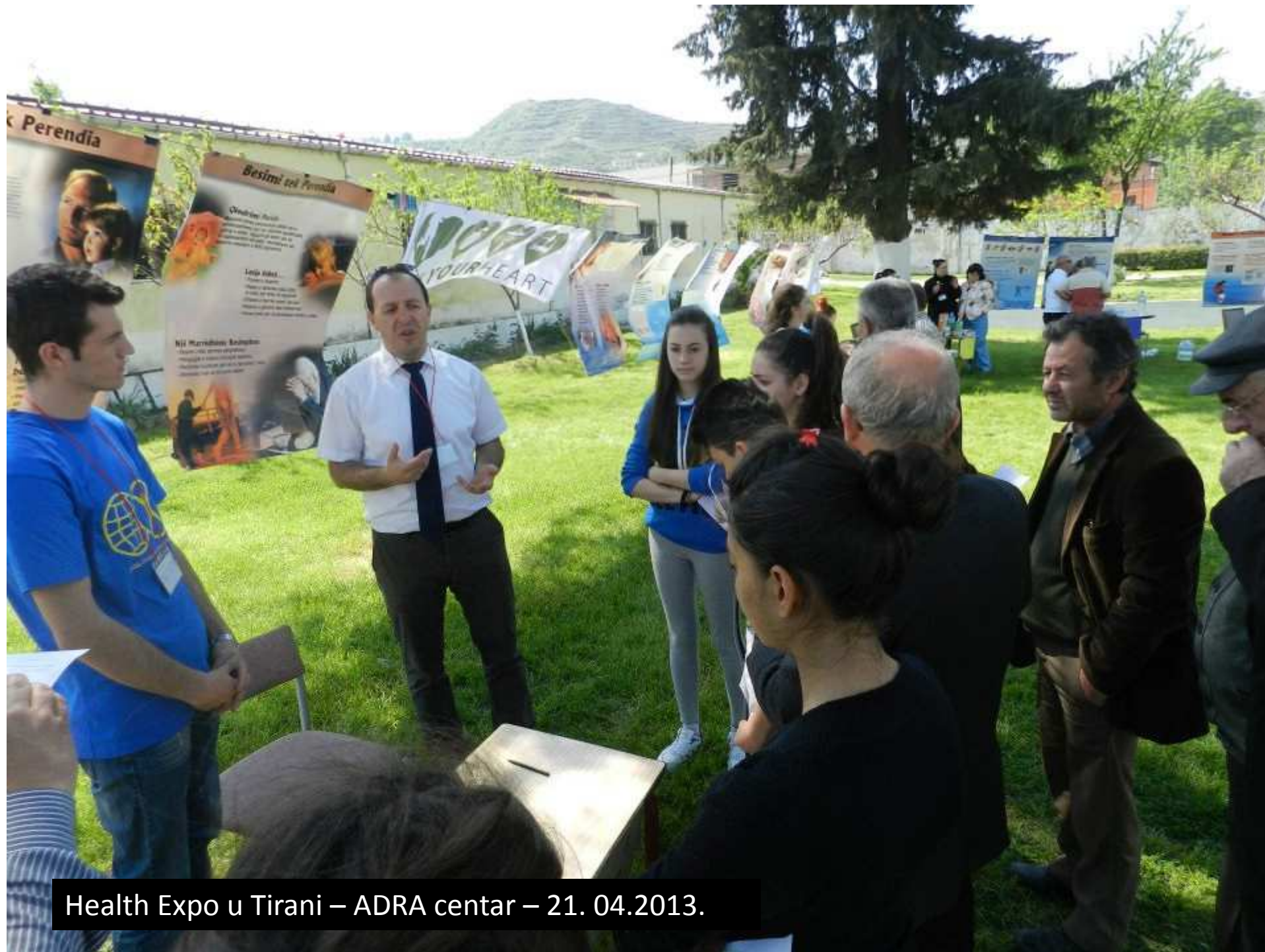
Health Expo u Tirani – ADRA centar – 21. 04.2013.