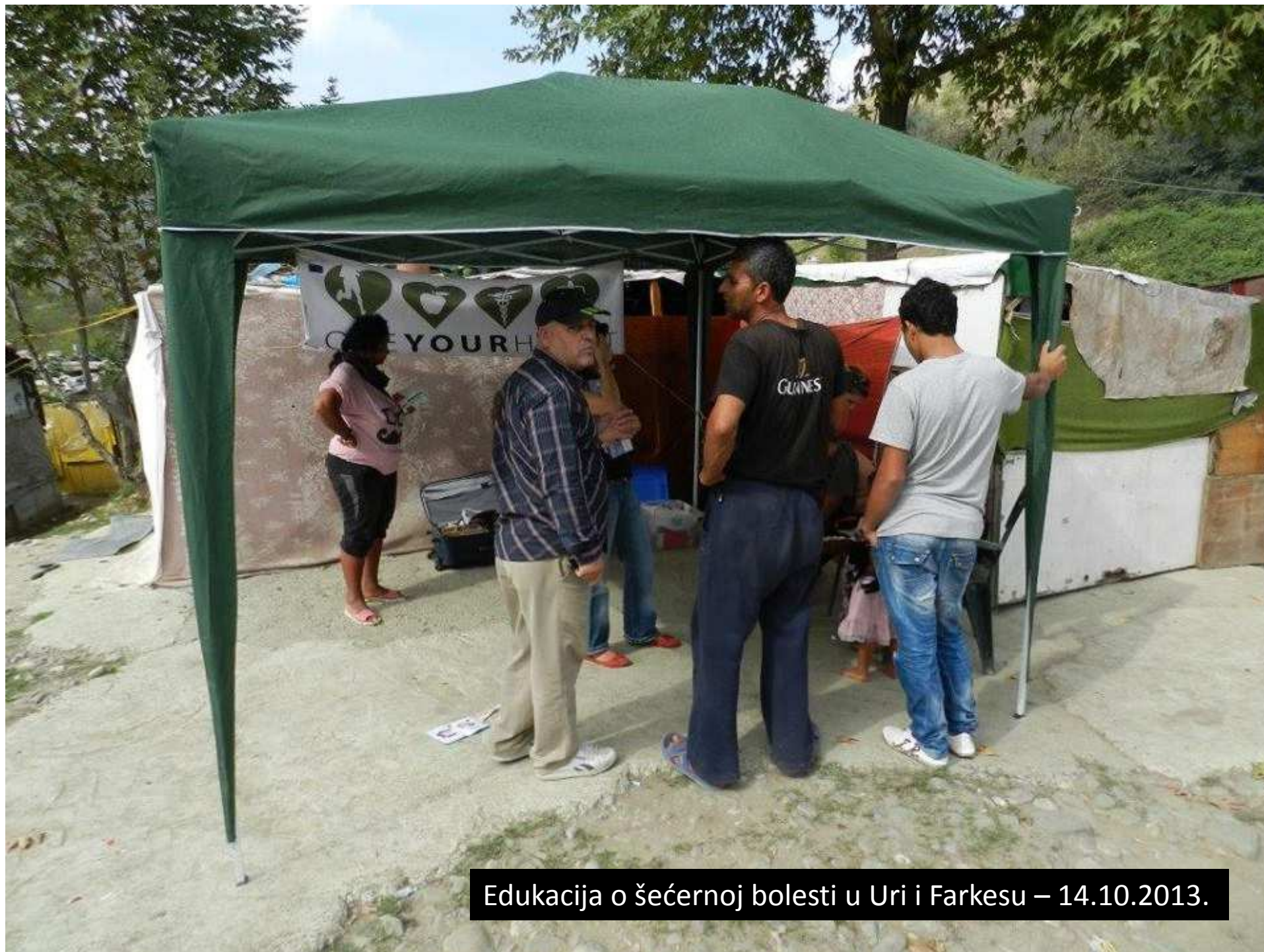
Edukacija o šećernoj bolesti u Uri i Farkesu – 14.10.2013.