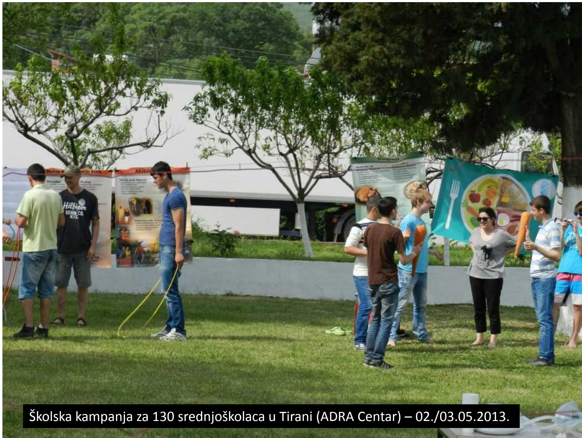
Školska kampanja za 130 srednjoškolaca u Tirani (ADRA Centar) – 02./03.05.2013.