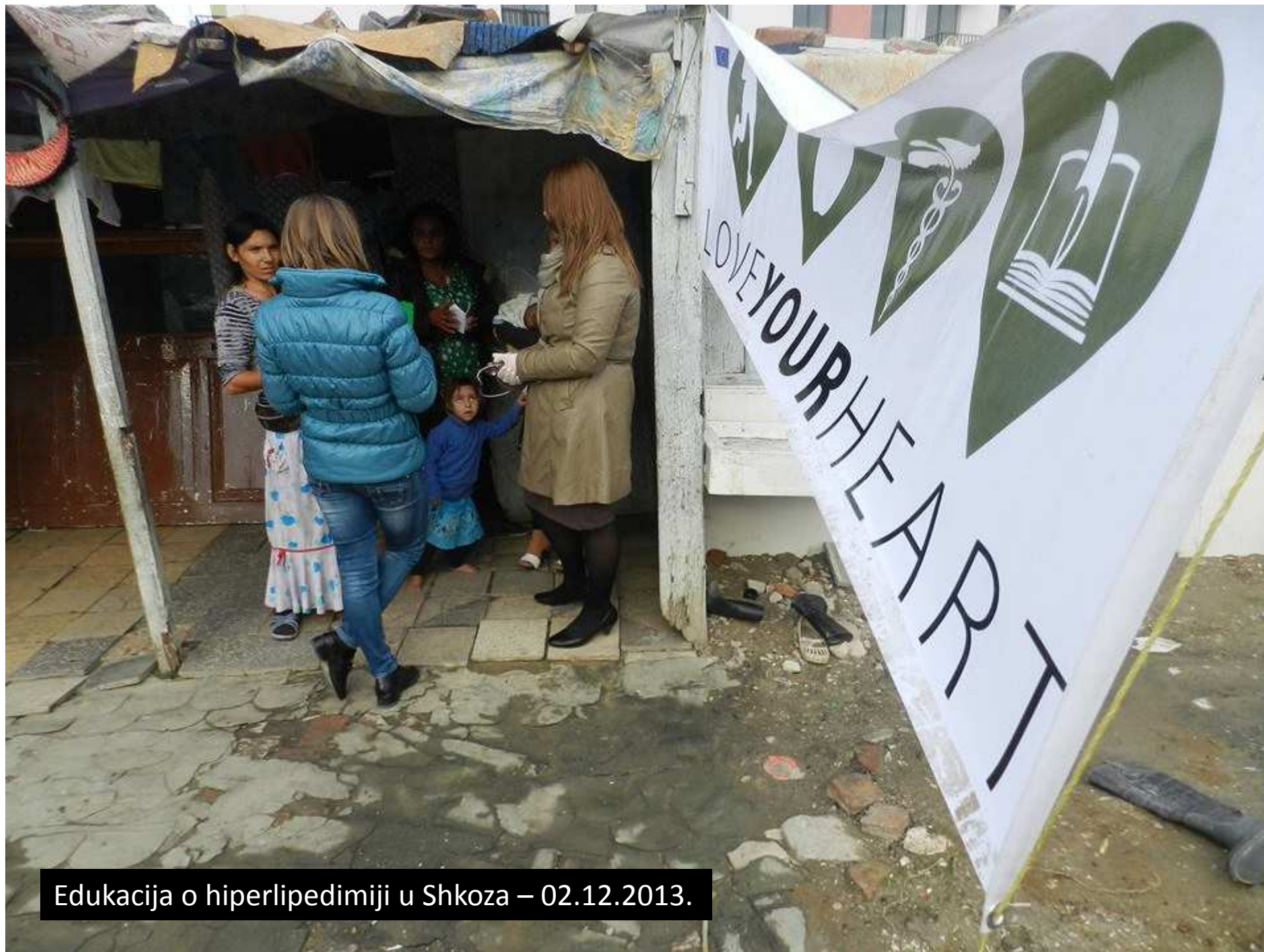
Edukacija o hiperlipidemiji u Shkoza – 02.12.2013.