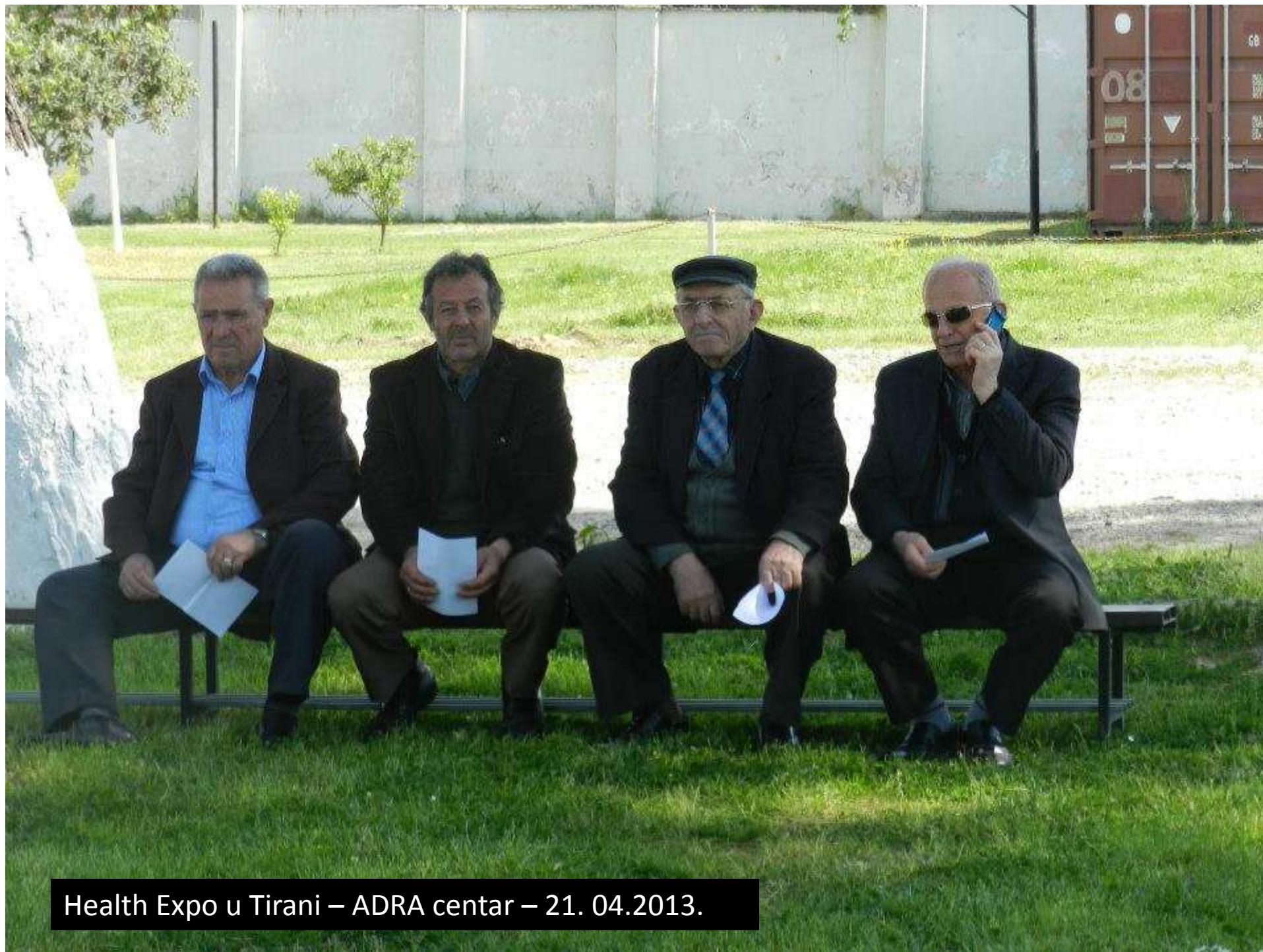
Health Expo u Tirani – ADRA centar – 21. 04.2013.