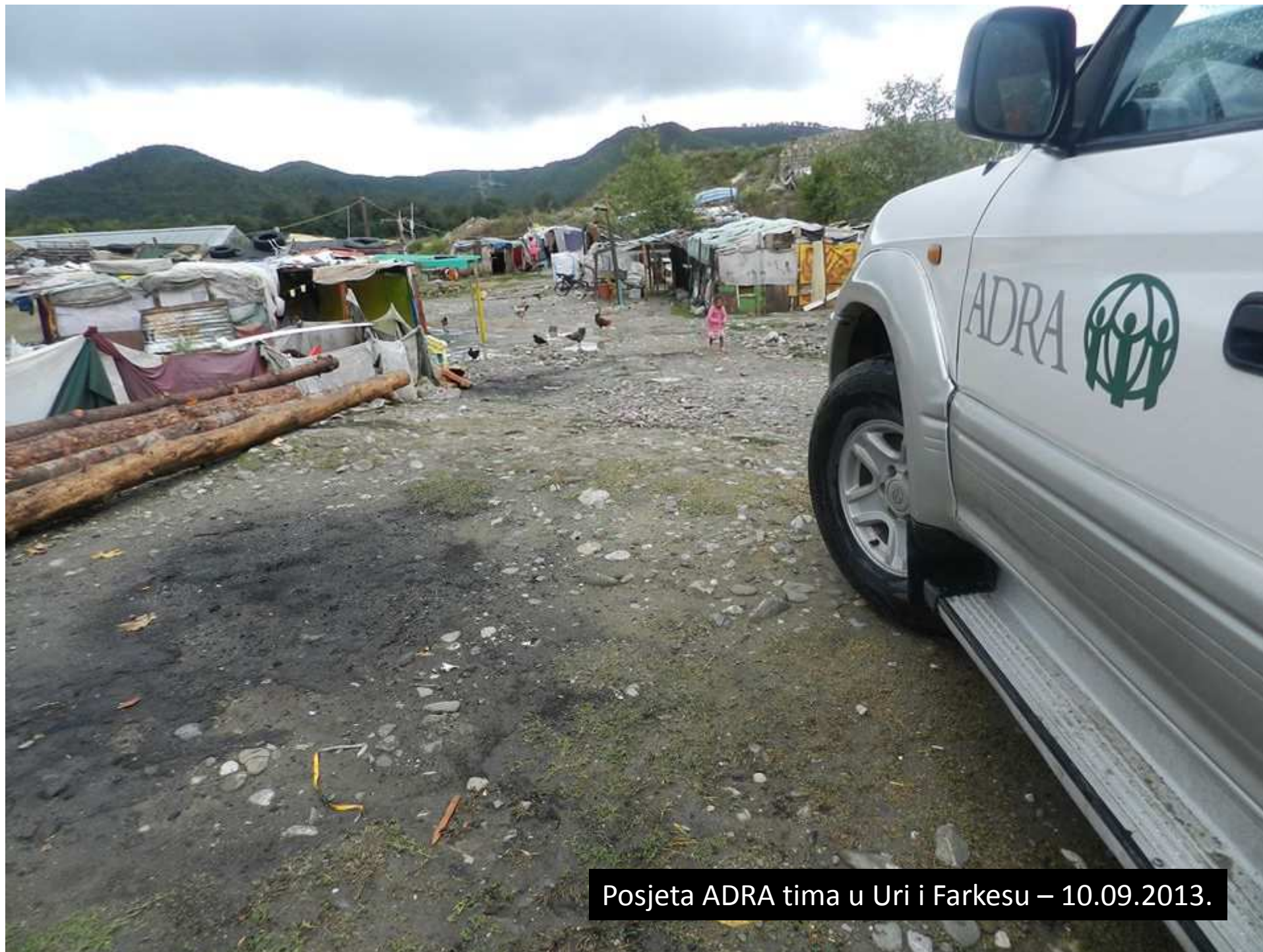
Posjeta ADRA tima u Uri i Farquesu – 10.09.2013.