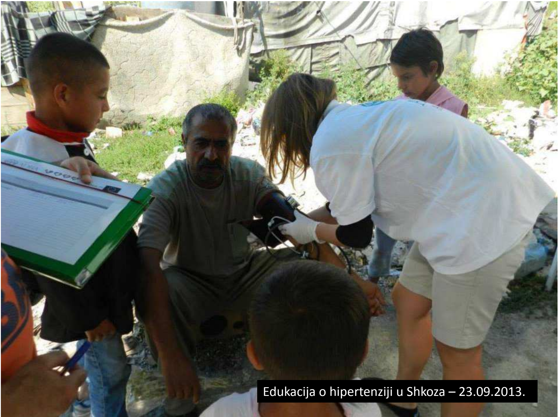
Edukacija o hipertenziji u Shkoza – 23.09.2013.