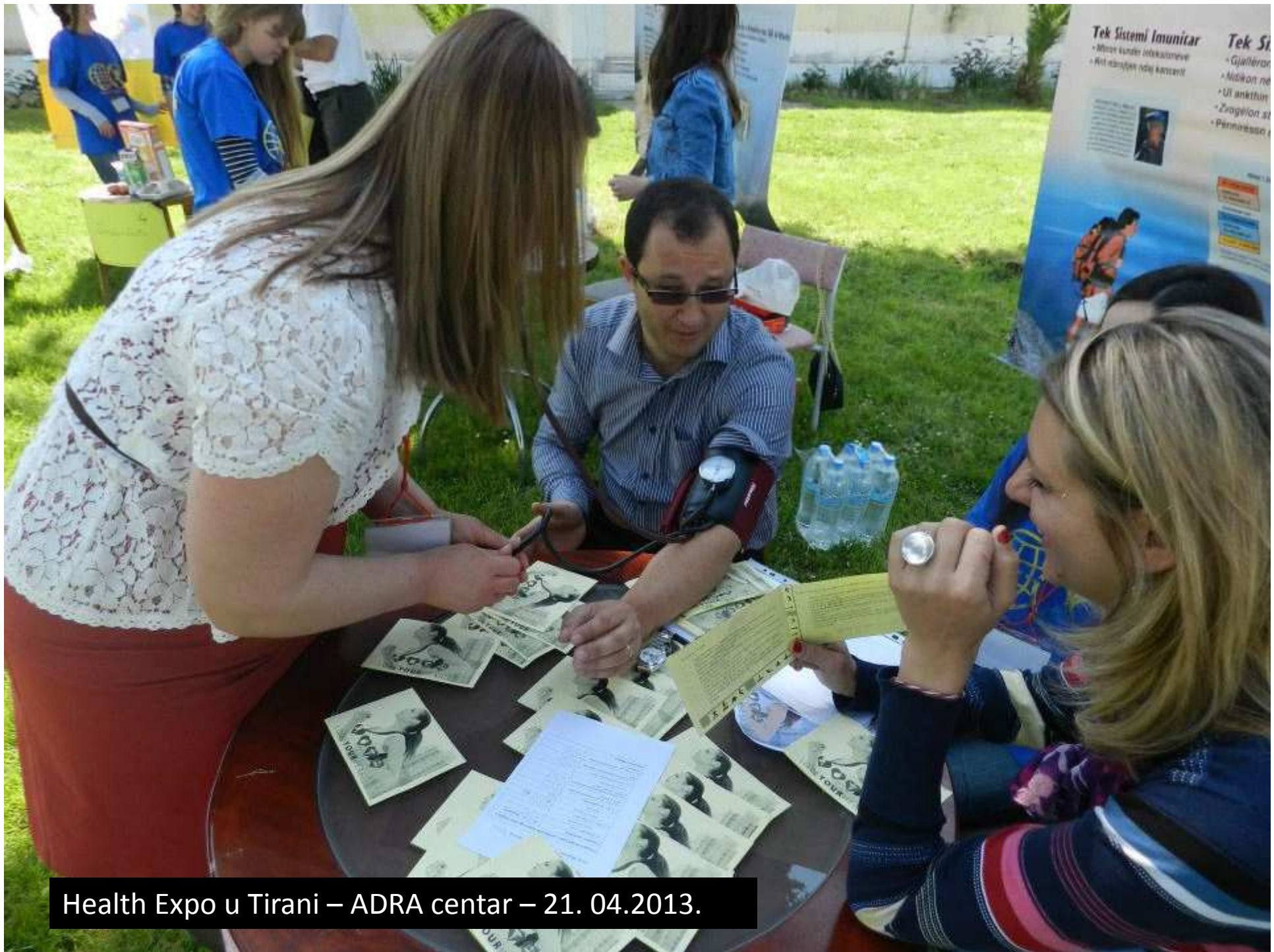
Health Expo u Tirani – ADRA centar – 21. 04.2013.