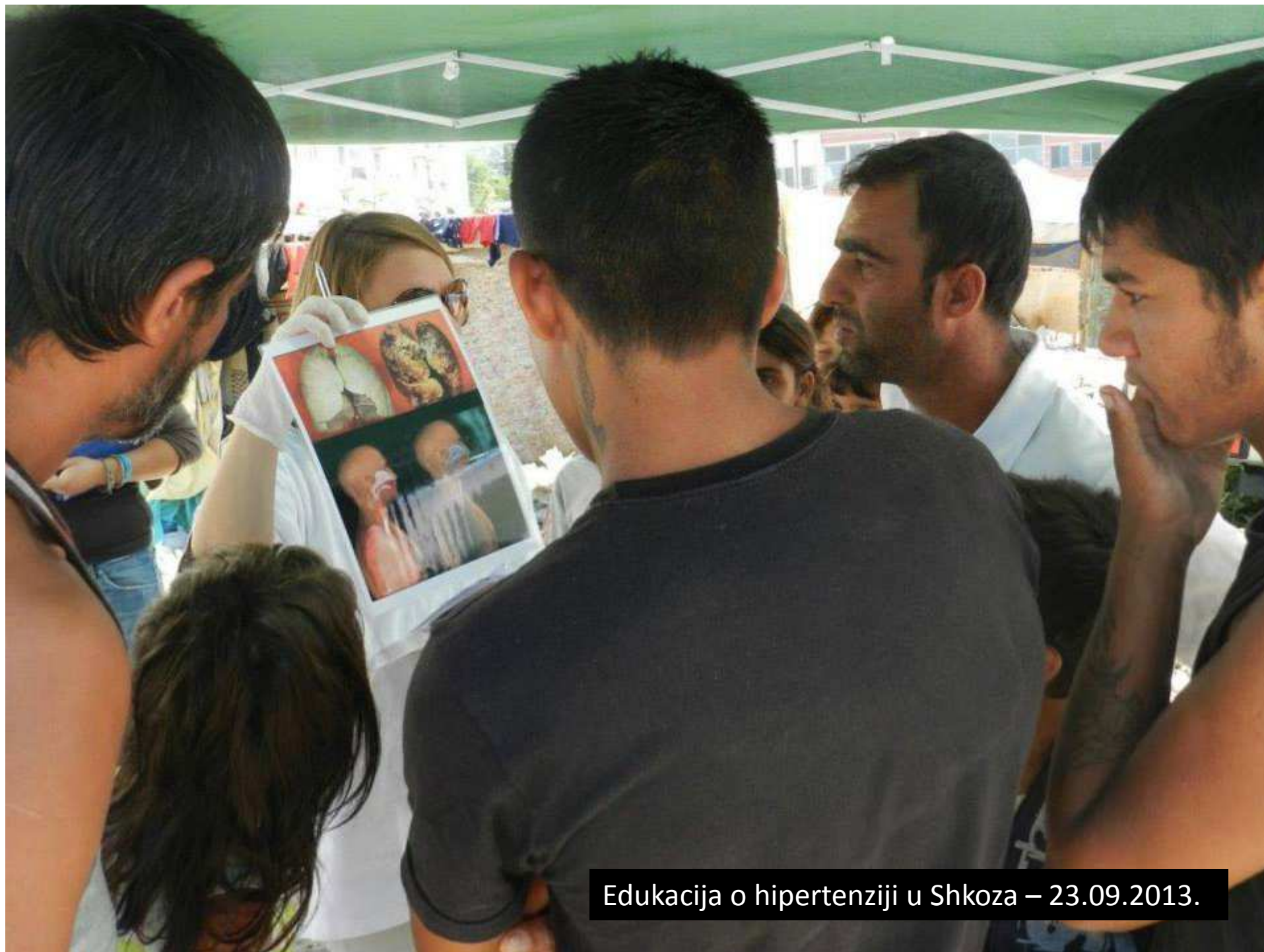
Edukacija o hipertenziji u Shkoza – 23.09.2013.