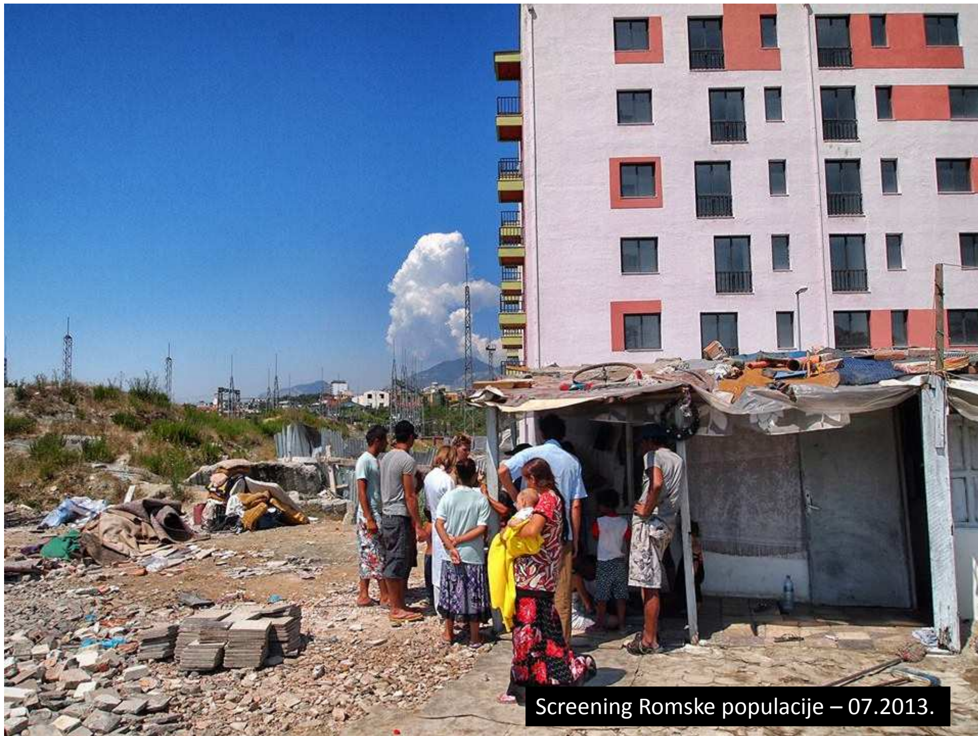
Screening Romske populacije – 07.2013.