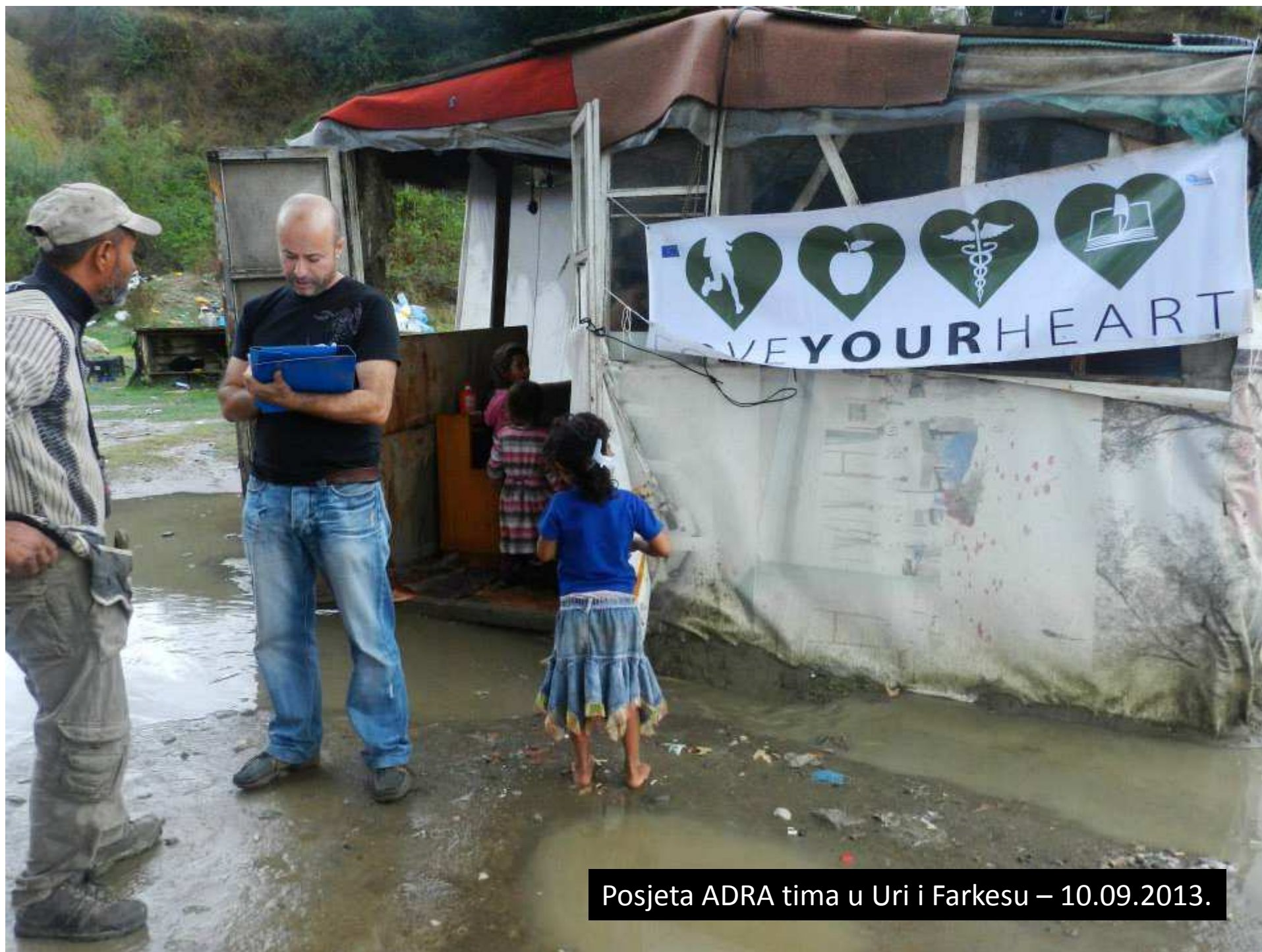
Posjeta ADRA tima u Uri i Farkesu – 10.09.2013.