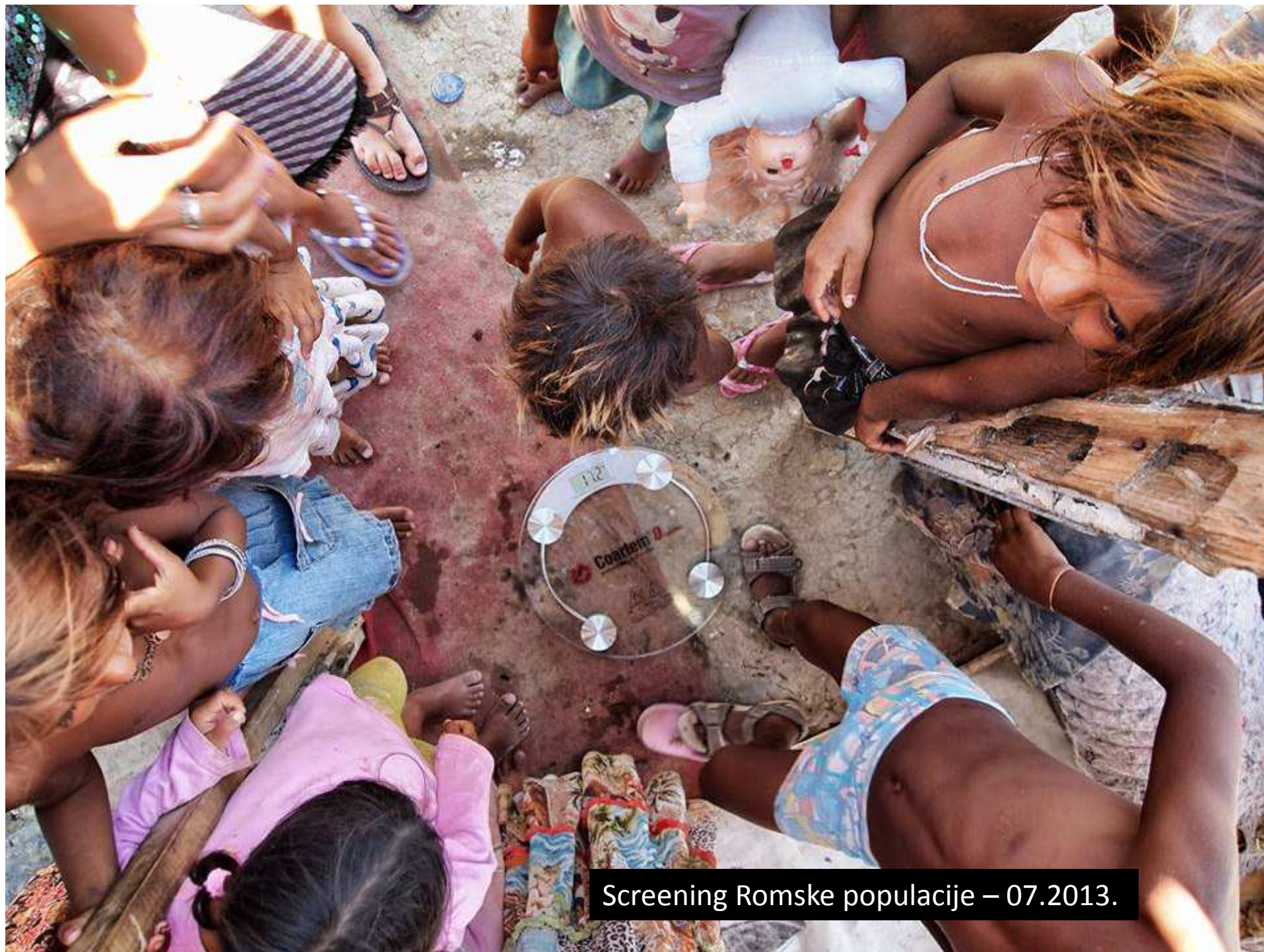
Screening Romske populacije – 07.2013.