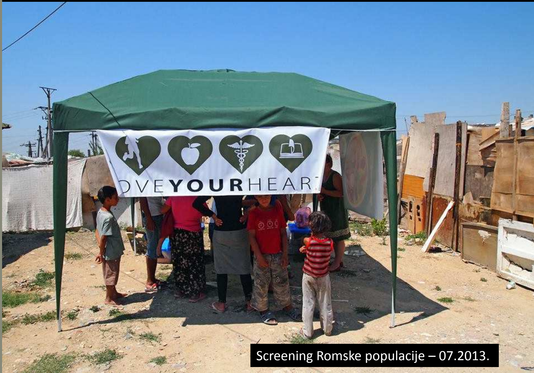
Screening Romske populacije – 07.2013.

During July 2013, ADRA health team has started the screening process of Roma communities located in Bregu I Lumit, Shkoza, Ura a Farkes , Ligeni and Fushe Kruja. Our aim was to identify the high-risk patients who will be targeted and recruited in the upcoming months in cardiovascular diseases prevention programs . Please have a look through these photos at some of our work.