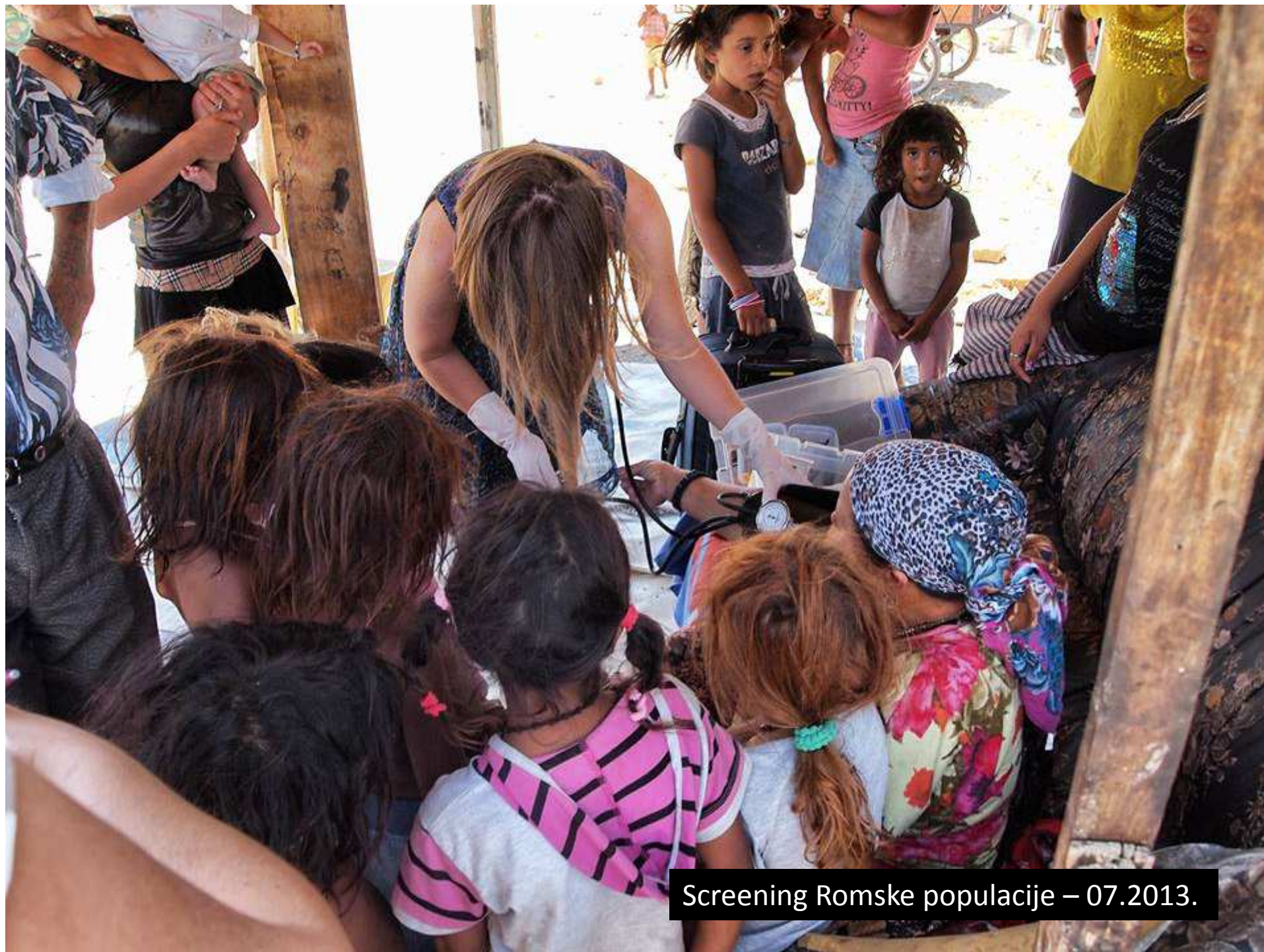
Screening Romske populacije – 07.2013.