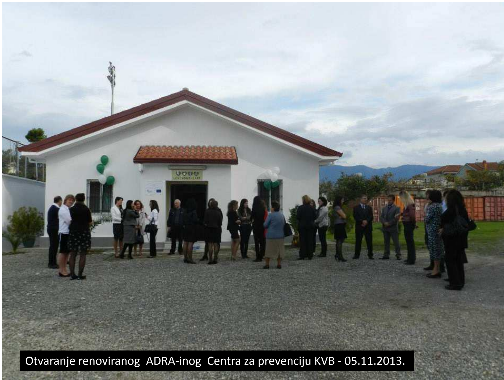
Otvaranje renoviranog ADRA-inog Centra za prevenciju KVB - 05.11.2013.