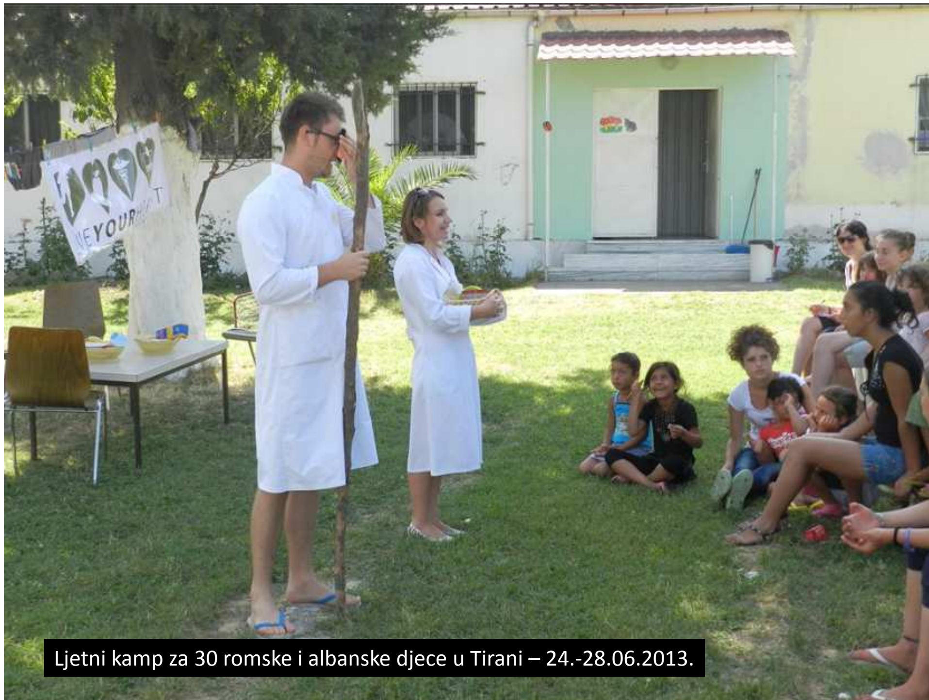
Ljetni kamp za 30 romske i albanske djece u Tirani – 24.-28.06.2013.