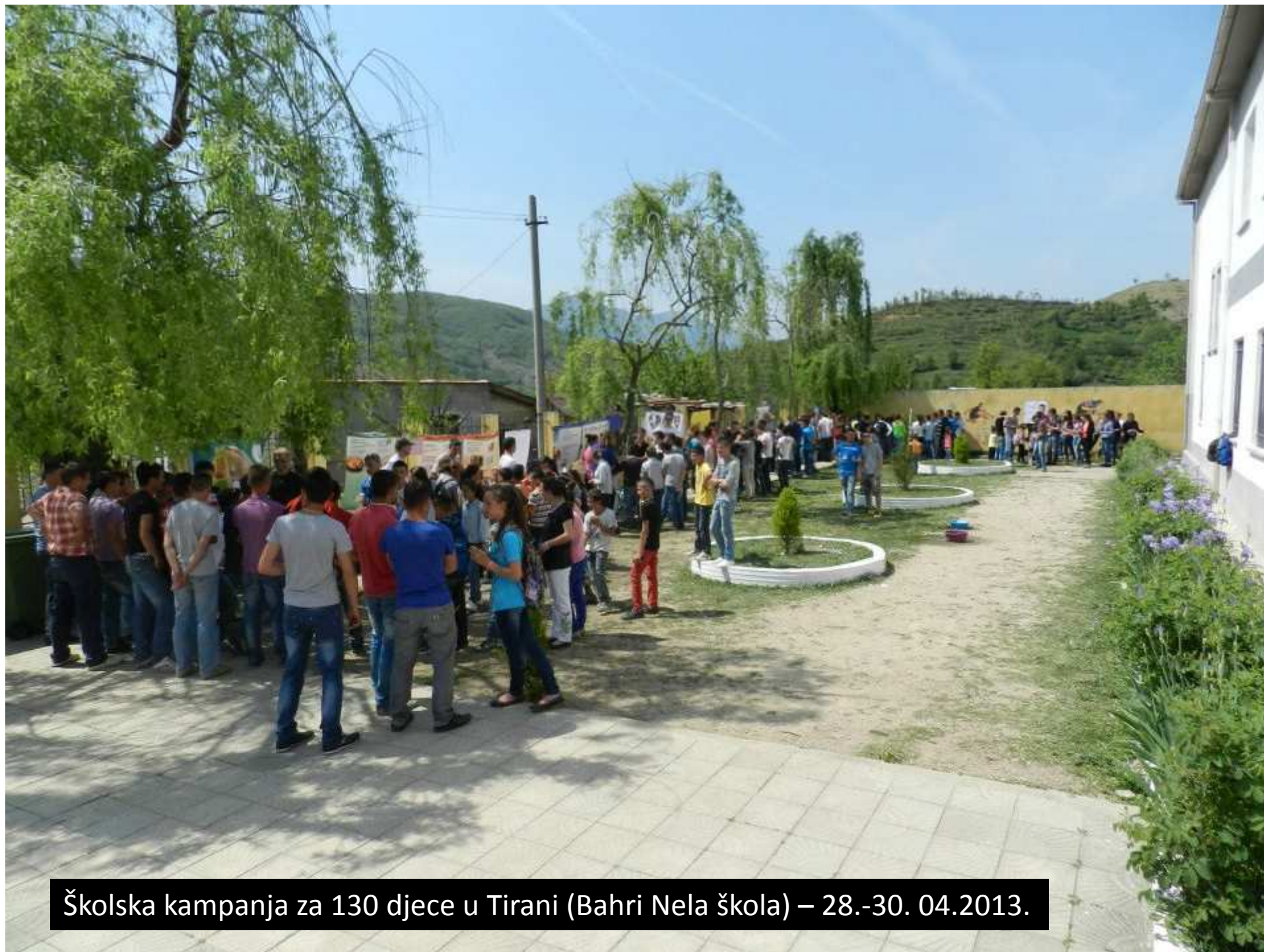
Školska kampanja za 130 djece u Tirani (Bahri Nela škola) – 28.-30. 04.2013.