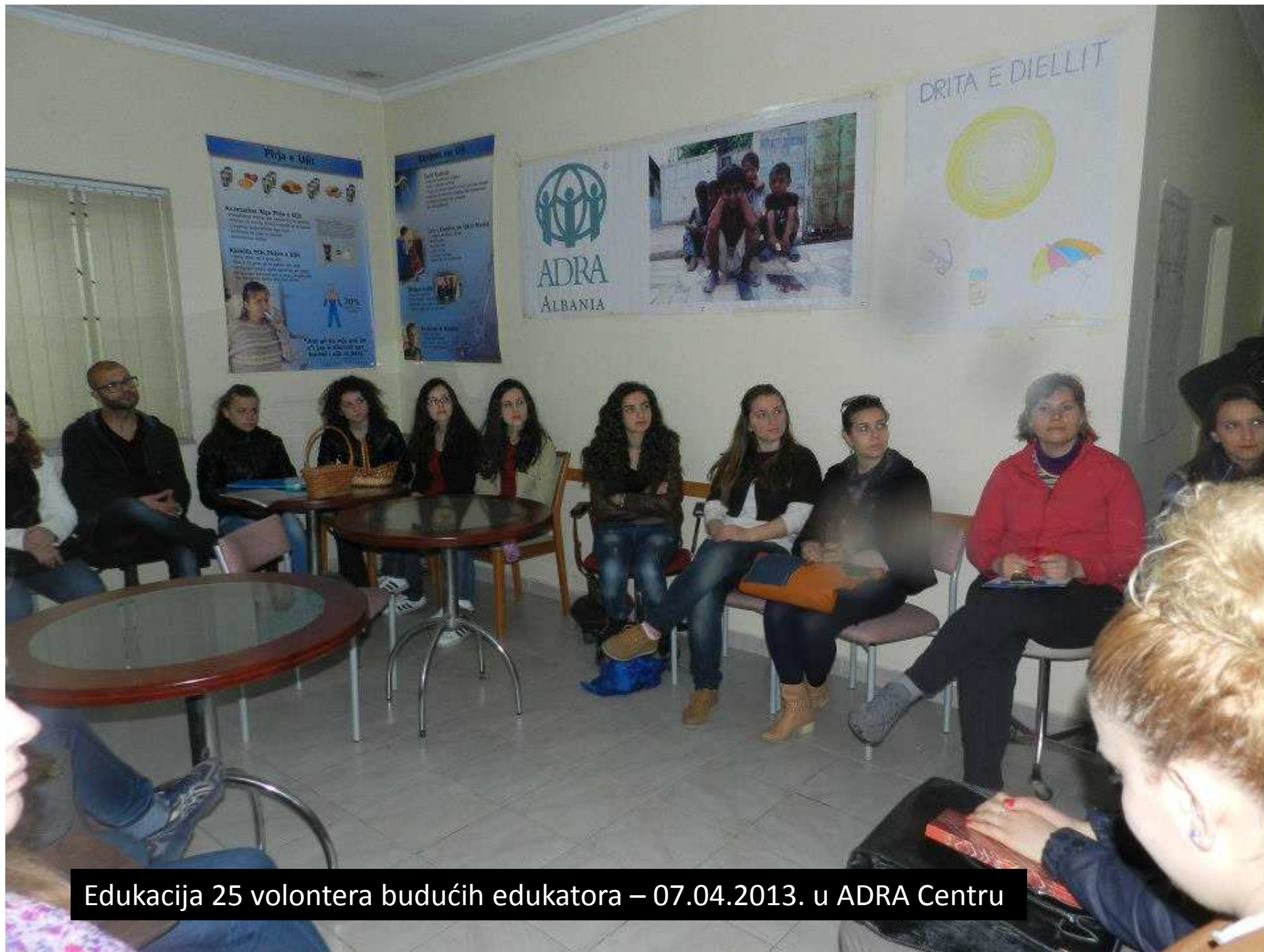
Edukacija 25 volontera budućih edukatora – 07.04.2013. u ADRA Centru