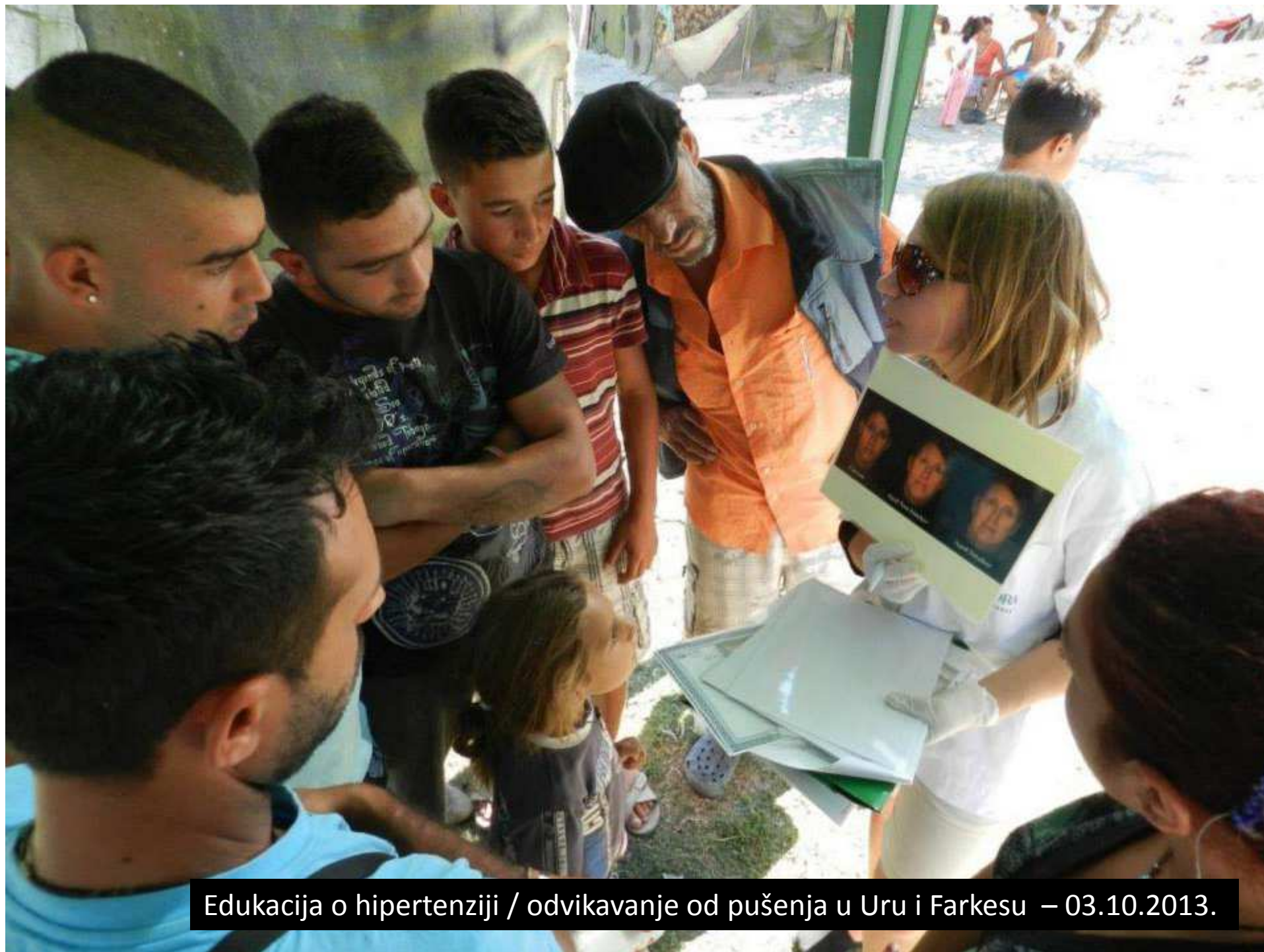
Edukacija o hipertenziji / odvikavanje od pušenja u Uru i Farkesu – 03.10.2013.