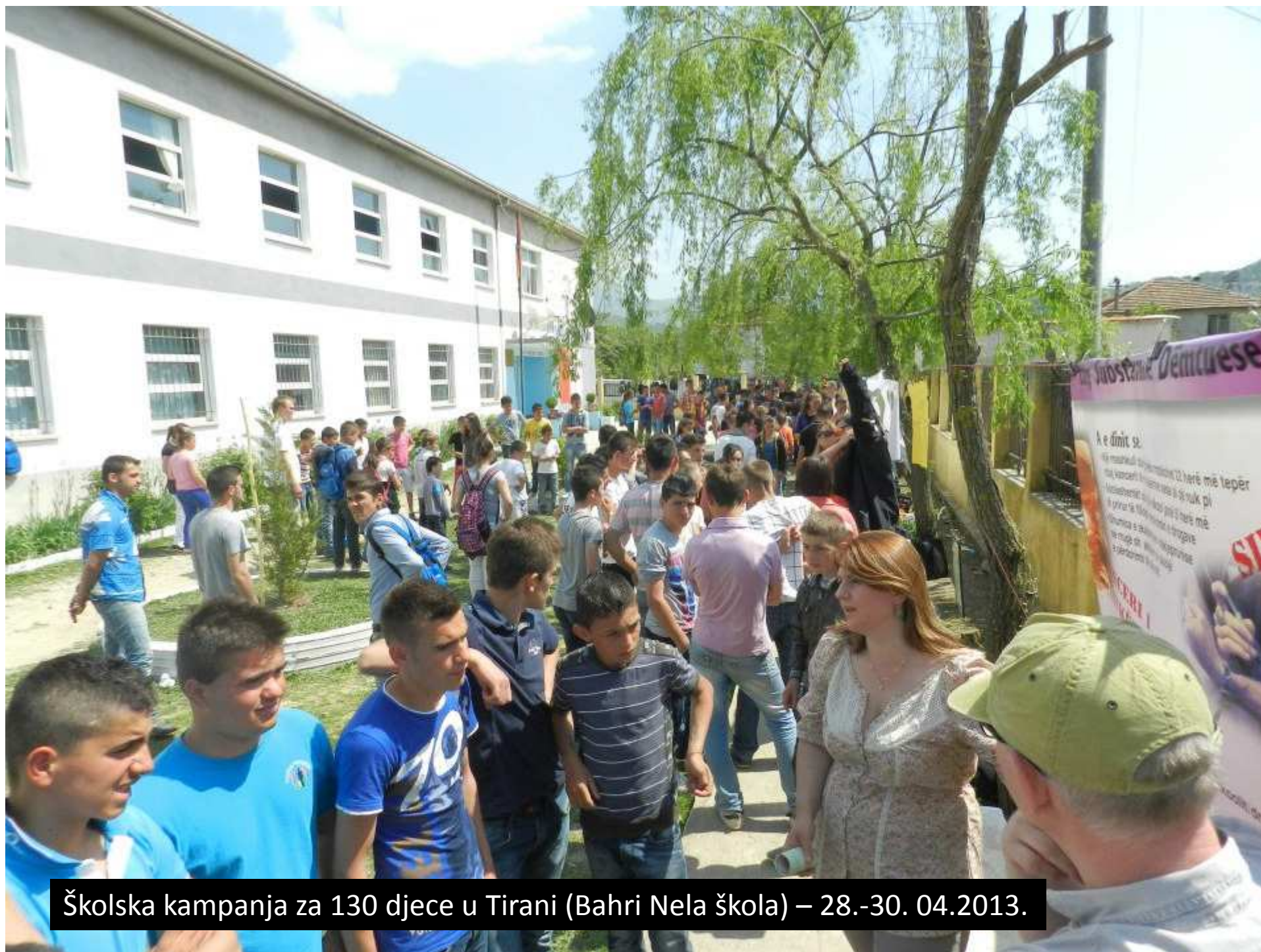
Školska kampanja za 130 djece u Tirani (Bahri Nela škola) – 28.-30. 04.2013.