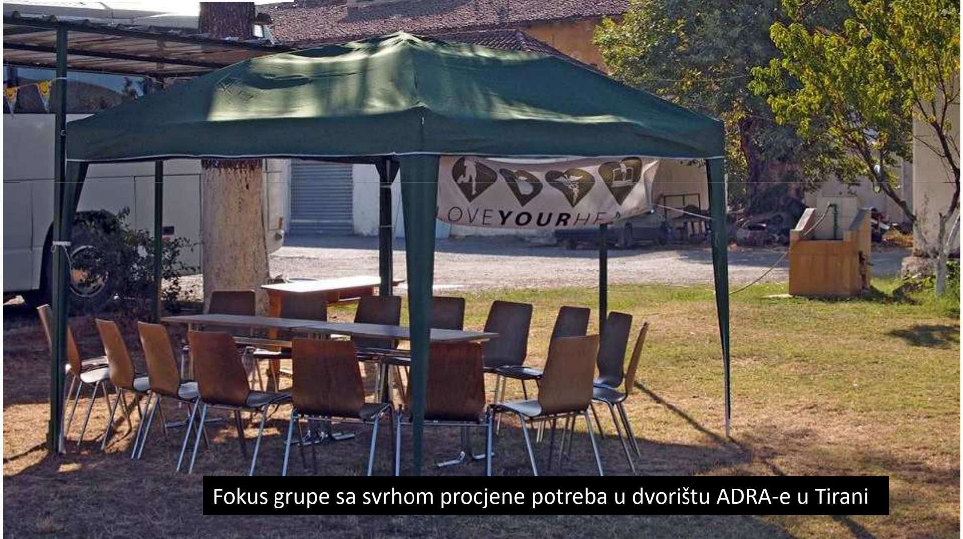
Fokus grupe sa svrhom procjene potreba u dvorištu ADRA-e u Tirani

Please have a look at our last activity, the focus group, organized in the yard next to ADRA Health Center. Through this activity, our team had the opportunity to ask a serial of questions related to heart diseases and their risk factors. The opinions shared by the participants are very valuable and helpful in order to develop better cardiovascular diseases prevention programs for Albanian citizens. — u Tirana, Albania.