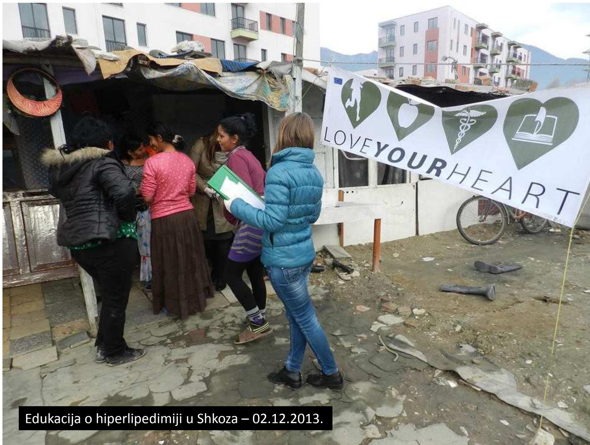
Edukacija o hiperlipidemiji u Shkoza – 02.12.2013.