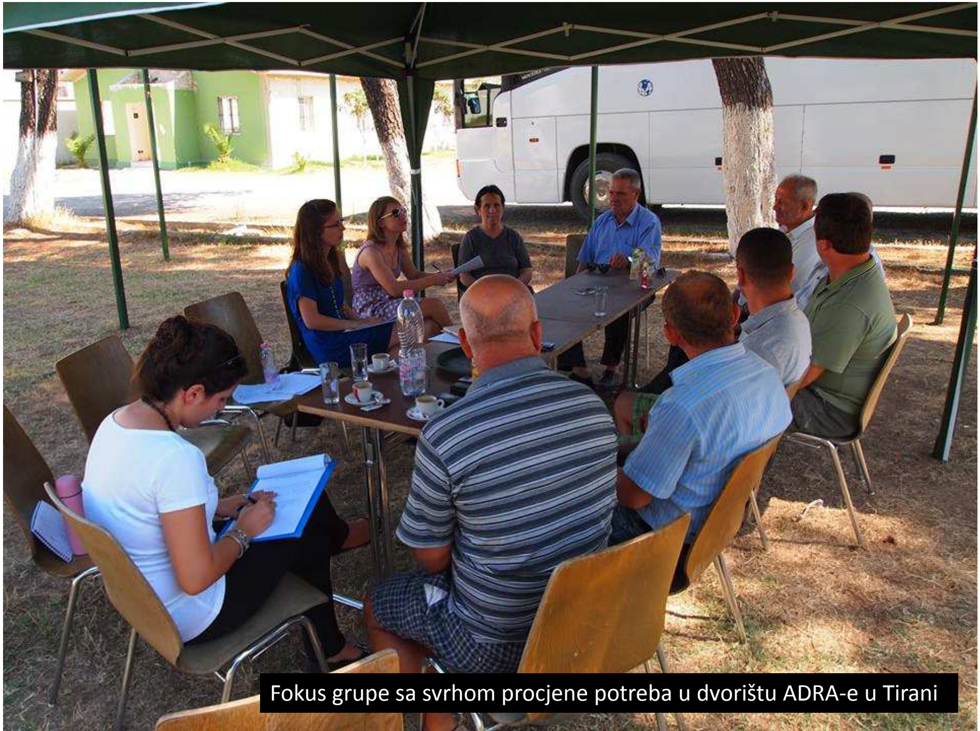
Fokus grupe sa svrhom procjene potreba u dvorištu ADRA-e u Tirani