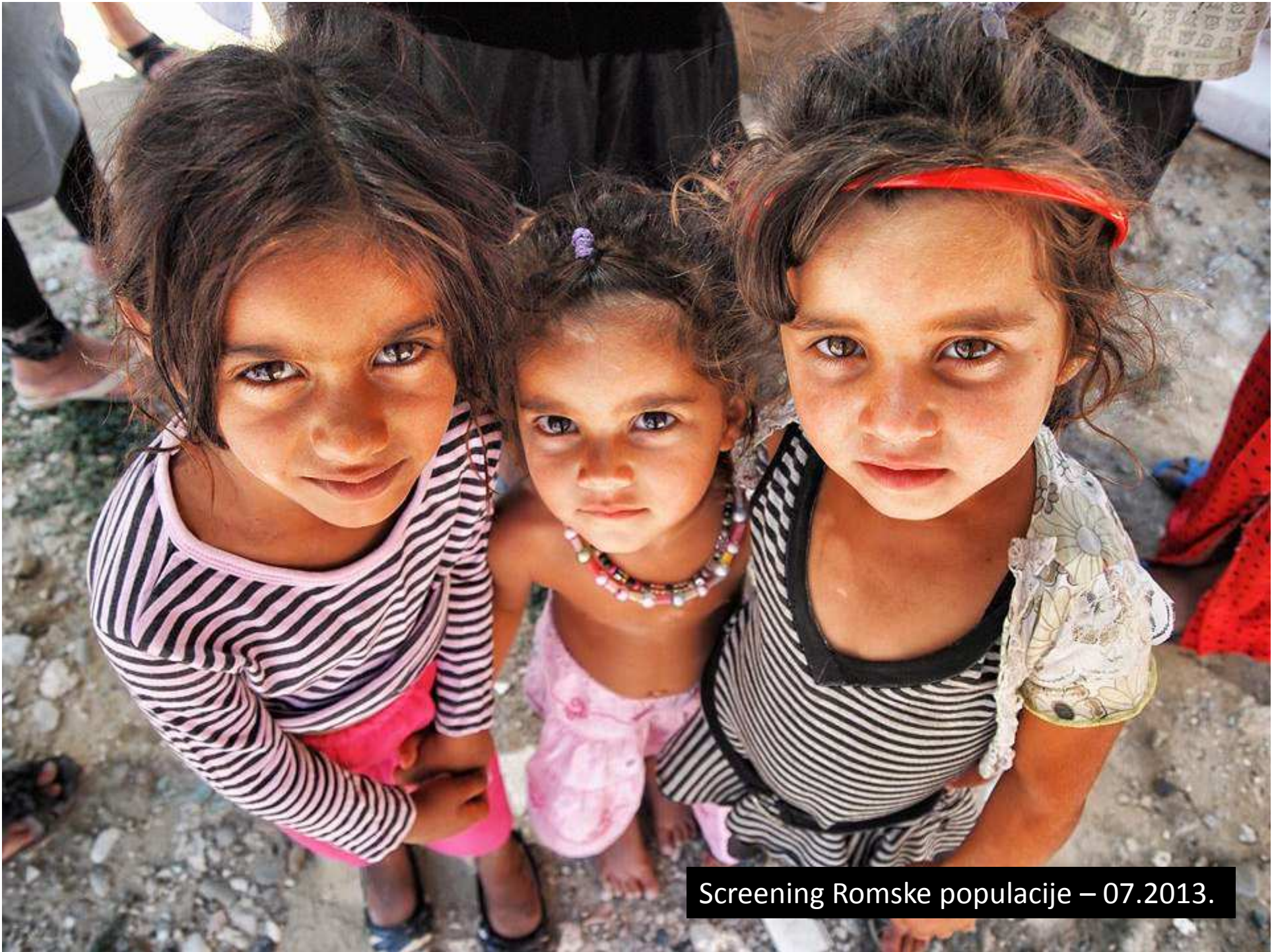
Screening Romske populacije – 07.2013.