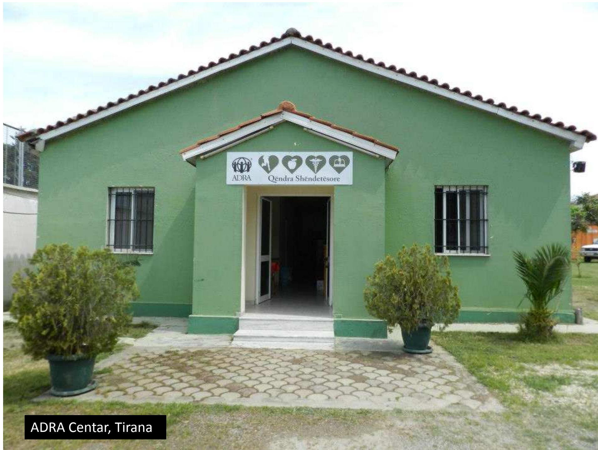
ADRA Centar, Tirana