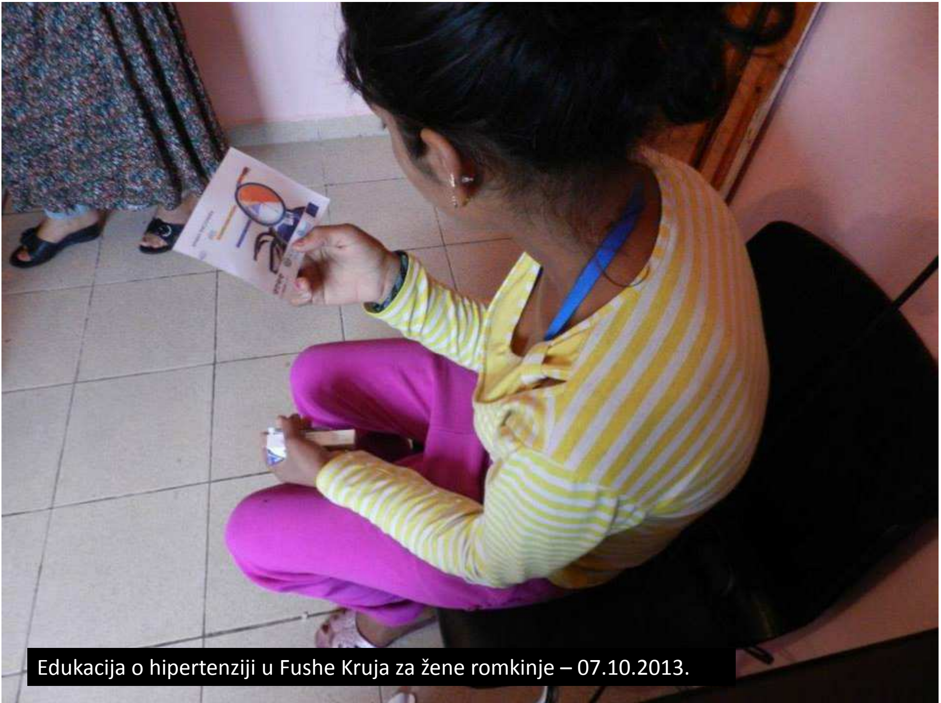
Edukacija o hipertenziji u Fushe Kruja za žene romkinje – 07.10.2013.