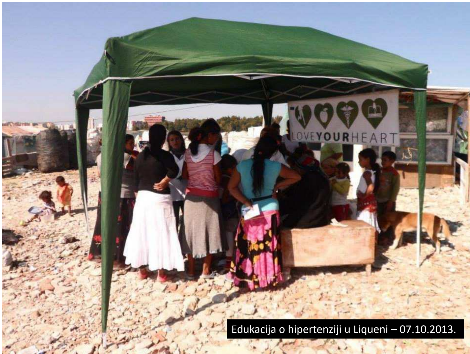
Edukacija o hipertenziji u Liqueni – 07.10.2013.