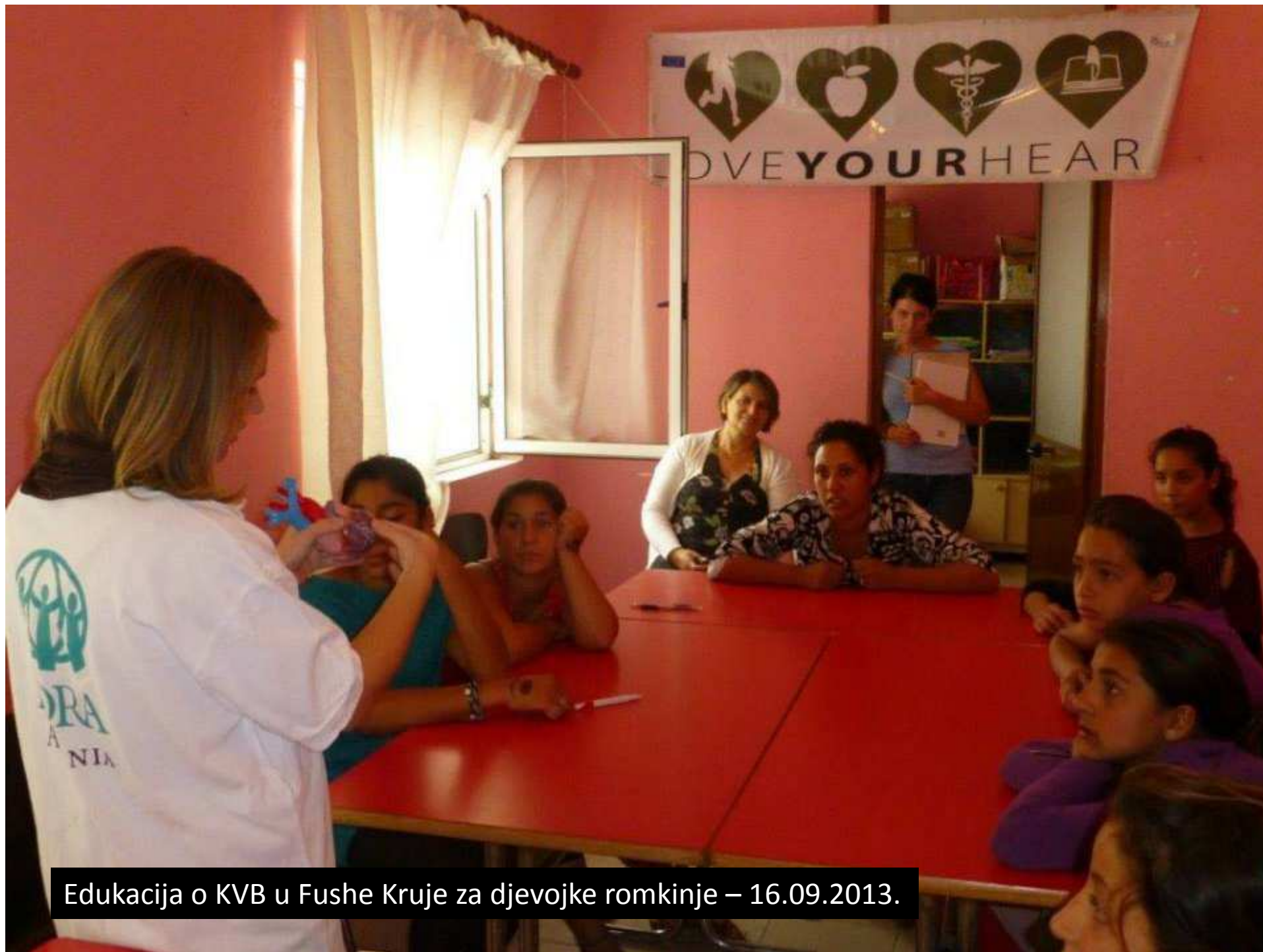
Edukacija o KVB u Fushe Kruje za djevojke romkinje – 16.09.2013.