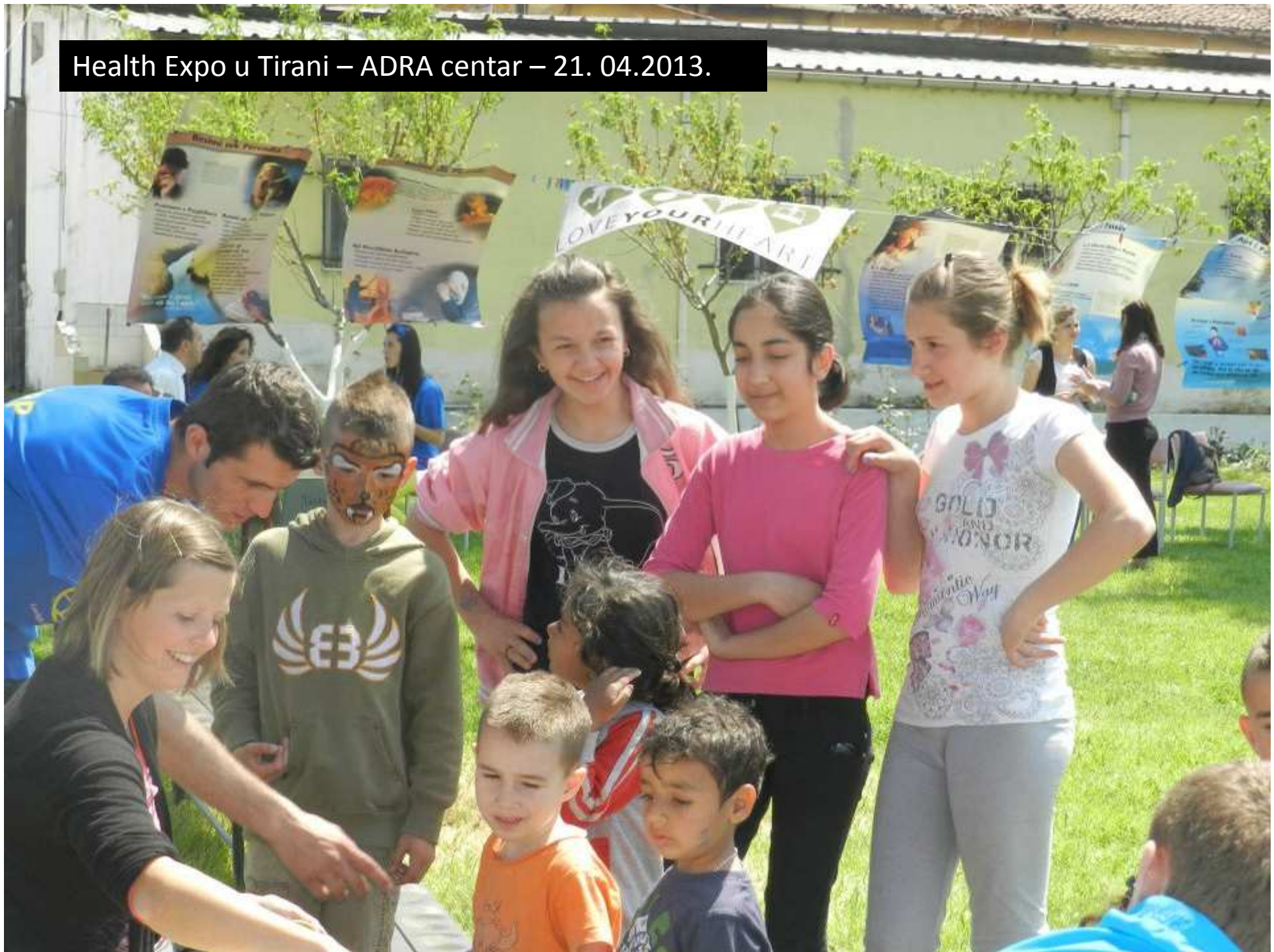
Health Expo u Tirani – ADRA centar – 21. 04.2013.