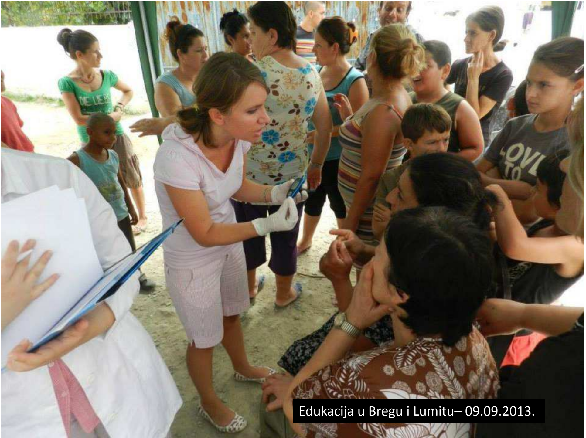
Edukacija u Bregu i Lunitu– 09.09.2013.