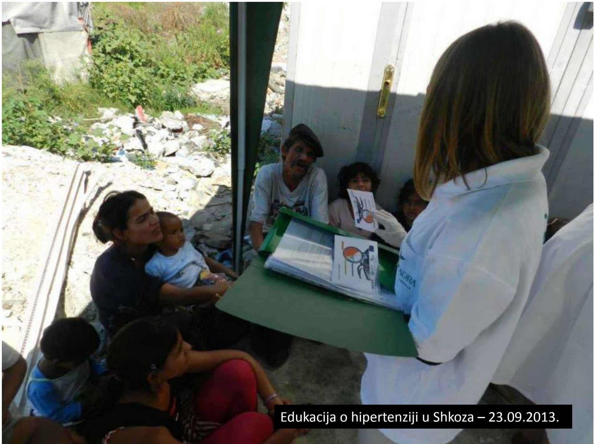
Edukacija o hipertenziji u Shkoza – 23.09.2013.