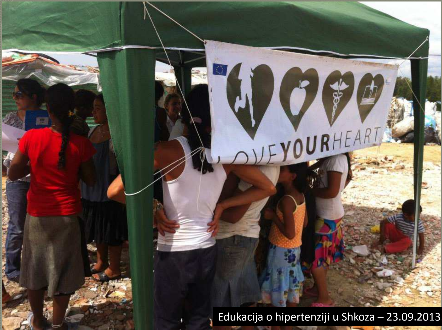
Edukacija o hipertenziji u Shkoza – 23.09.2013.