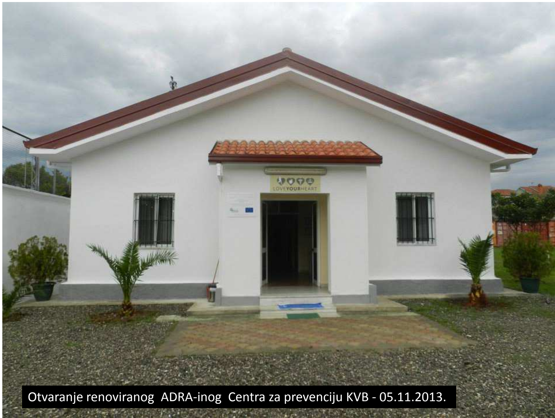
Otvaranje renoviranog ADRA-inog Centra za prevenciju KVB - 05.11.2013.