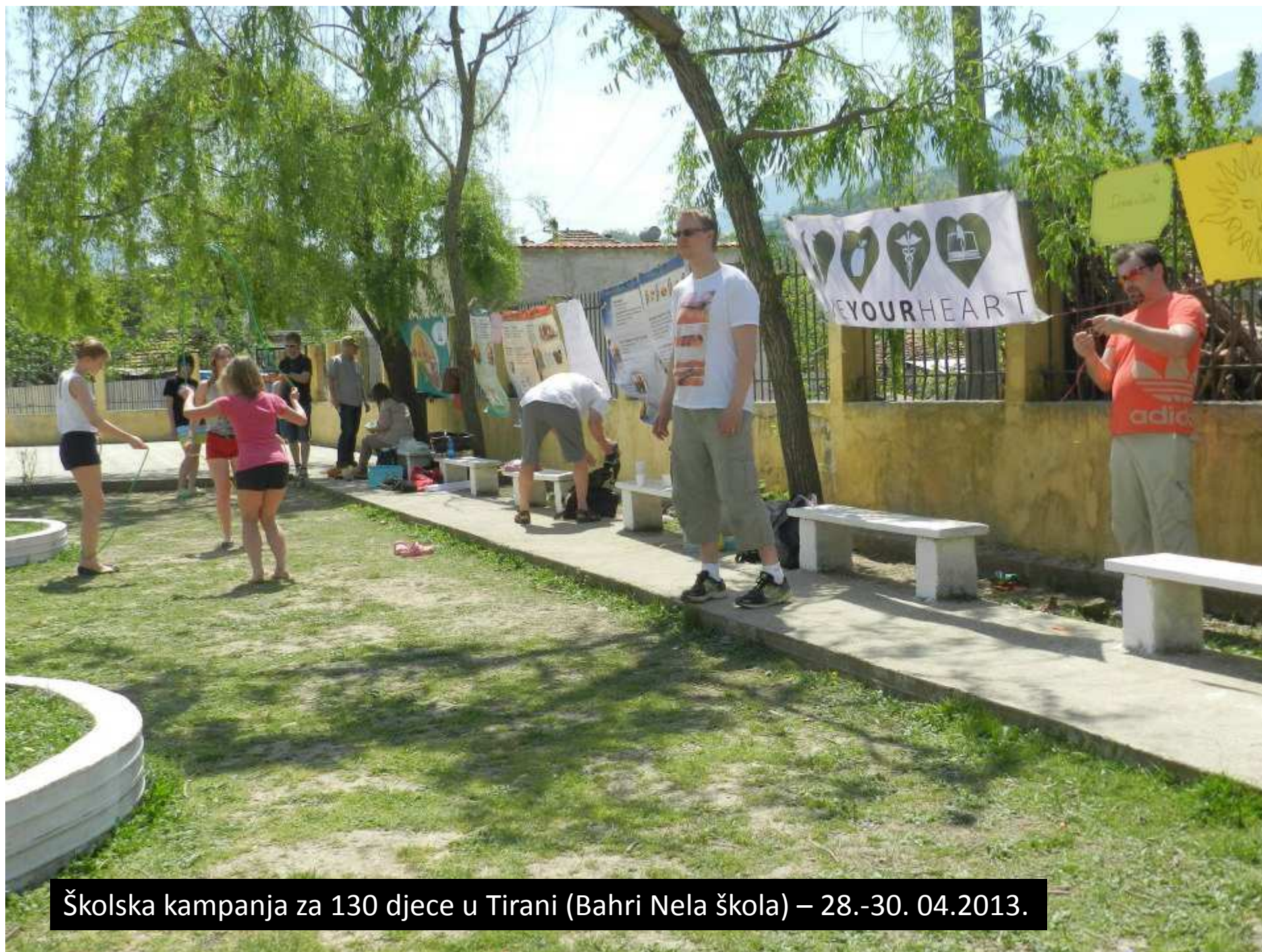
Školska kampanja za 130 djece u Tirani (Bahri Nela škola) – 28.-30. 04.2013.