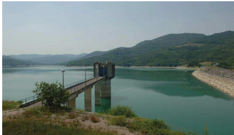
Slika 4. Akumulacija Butoniga

Akumulacija Butoniga se nalazi nizvodno od mjesta gdje se susreću tri glavna bujična ogranka – Butoniga, Dragučki i Račićki potok (Slika 4). Sliv akumulacije nalazi se unutar fliškog bazena središnjeg dijela poluotoka. Površina sliva iznosi 73 km 2 , a maksimalna dubina vode u akumulaciji doseže oko 16 metara. Volumen akumulacije iznosi 19,7 milijuna m 3 , pri čemu se na korisni volumen odnosi 17,5 milijuna m 3 . Iz akumulacije se vrši cjelogodišnje crpljenje za vodoopskrbu, s intenzitetima koji ne padaju ispod 200 litara u sekundi kako bi se osigurao kontinuitet rada uređaja za kondicioniranje i minimalne brzine tečenja u magistralnim cjevovodima sustava Butoniga. Akumulacija Butoniga ima ključnu ulogu u vodoopskrbi južne Istre, posebice tijekom ljetnih razdoblja s visokom potrošnjom. Tijekom ljetnih 90-ak dana, intenziteti crpljenja se povećavaju na vrijednosti do maksimalno 500 – 600 litara u sekundi.