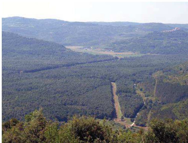
Slika 7. Motovunska šuma

Na obroncima Ćićarije i Učke smještena je eurosibirska zona, gdje su bukove šume dominantne. Ovdje se uglavnom nalaze šume sjemenjače, s područjima pod crnim borom. Ove šume imaju gospodarski značaj zbog proizvodnje kvalitetne drvne mase.