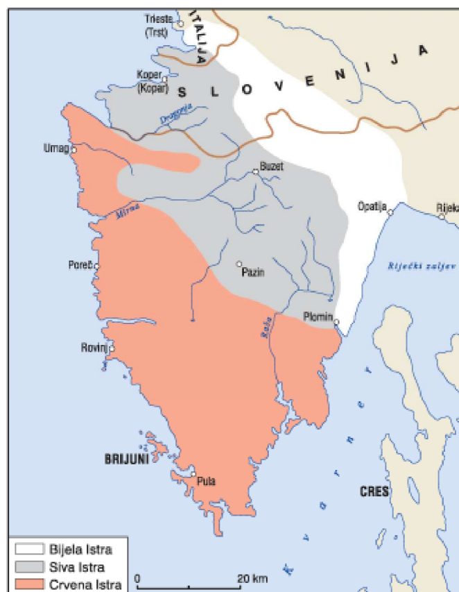
Slika 6. Geomorfološka podjela Istre ( www.poistri.eu )

Raznolika tla s različitim fizikalnim svojstvima ključna su komponenta za procjenu pogodnosti za poljoprivrednu proizvodnju. Najčešći tip tla je crvenica (oko 45%), dok se oko 25% tla sastoji od smeđeg tla na vapnencu i dolomitu. Nedostatak sustavnog praćenja kvalitete tla na nacionalnoj i županijskoj razini nažalost znači da ne postoje podaci o stanju onečišćenosti tla u Istri. To onemogućava praćenje promjena u stanju tla i identifikaciju oštećenja uzrokovanih ljudskim ili prirodnim faktorima. Pojedinačni uzorci analiza kemijskog sastava poljoprivrednih tala u Istri pokazuje siromašnu opskrbu fosforom, srednje do bogate razine kalija, dok su crvenice i antropogena tla siromašna dušikom.