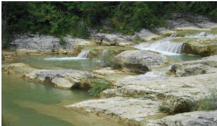
Slika 3. Pazinčica ( www.istrapedia.hr )

Pazinčica je najduža ponornica u Istri, izvire u zaleđu Boruta i ima pet stalnih bočnih pritoka (Slika 3). Glavni tok Pazinčice dugačak je 18 km, a obilježava ju izrazita bujičnost i pojave velikih voda. Sliv Pazinčice izdužen je u pravcu sjeverozapad-jugoistok, s strmim bočnim pritocima koji se gotovo okomito spuštaju.