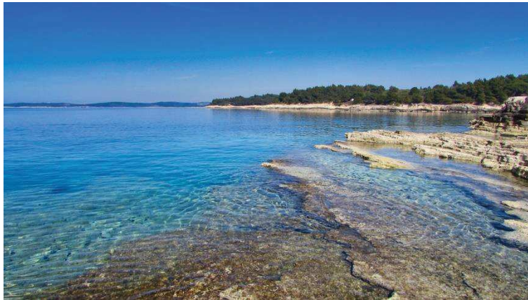
Slika 5. Zapadna obala Istre

Istarski poluotok, okružen Jadranskim morem sa tri strane, ima izuzetnu stratešku važnost mora kao prirodnog i ekonomskog resursa. Sjeverni Jadran je morfološka cjelina koja doseže dubine do 100 metara, s prosječnom dubinom od 35 metara. Ovo more ima visoku salinitetnu koncentraciju od 38,30‰, pri čemu područje Sjevernog Jadrana karakterizira nešto niža razina saliniteta zbog priliva voda iz velikih talijanskih rijeka. Jadran je umjereno toplo more, s površinskim temperaturama koje ljeti dosežu iznad 25°C, dok su najniže temperature zabilježene u veljači, oko 7°C.