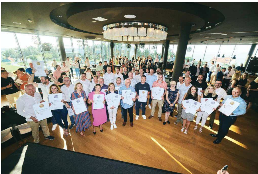
Slika 8. Nagrađeni istarski vinari na natjecanju Decanter 2024

Istra je vodeća hrvatska vinarska županija. Istarska vina, posebice Malvazija istarska postiže vrhunsku kakvoću i premijske cijene na domaćem i vanjskim tržištima. Tome svjedoče i brojne nagrade poput onih dobivenih zadnjih nekoliko godina na međunarodnim natjecanjima poput Decantera.