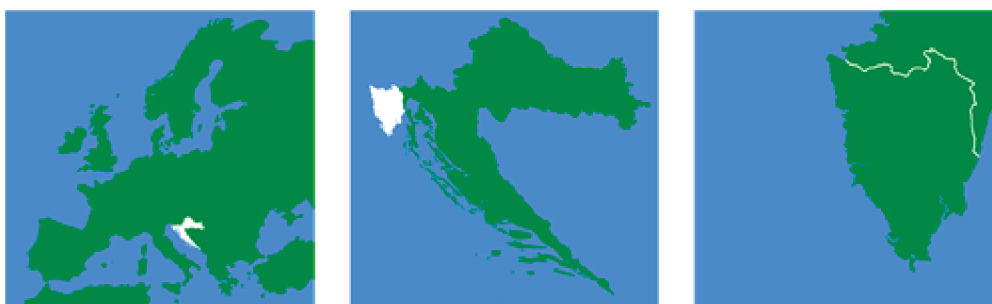
Slika 1. Položaj Istarske županije ( www.istra-istria.hr )

Istarski poluotok je geografski podijeljen između tri države: Republike Hrvatske, Republike Slovenije i Republike Italije (Slika 1). Manji dio sjeverne strane Miljskog poluotoka, površine manje od 40 m 2 , pripada Republici Italiji, Koparski zaljev i dio Piranskog zaljeva, ukupne površine 386 km 2 pripadaju Sloveniji. Glavnina poluotoka, koja obuhvaća površinu od 3.130 km 2 , nalazi se u sastavu Republike Hrvatske. Istarska županija proteže se većim dijelom Istarskog poluotoka. Ukupna površina Istarske županije iznosi 2.812,97 km 2 , a nalazi se na krajnjem sjeverozapadu Republike Hrvatske. Županija graniči s Primorsko-goranskom županijom na istoku i jugu, sa Slovenijom na sjeveru te s Italijom na zapadu duž morske obale koja se proteže 578 kilometara. Na području Istarske županije nalazi se 46 otoka i otočića te 42 manje nadmorske tvorbe (hridi). Zahvaljujući svojoj izuzetnoj lokaciji u sjeveroistočnom dijelu Jadranskog mora i blizini razvijenih europskih regija, geoprometni položaj Istarske županije je vrlo povoljan. Na primjer, administrativno središte Županije, Pazin, udaljeno je 539,95 km od Beča, 555,82 km od Budimpešte, 777,91 km od Rima i 946,00 km od Bruxellesa, dok je udaljenost do Beograda 606,78 km. Stoga je Županija oduvijek igrala važnu ulogu kao most koji povezuje srednjoeuropski kontinentalni prostor s mediteranskim područjem.