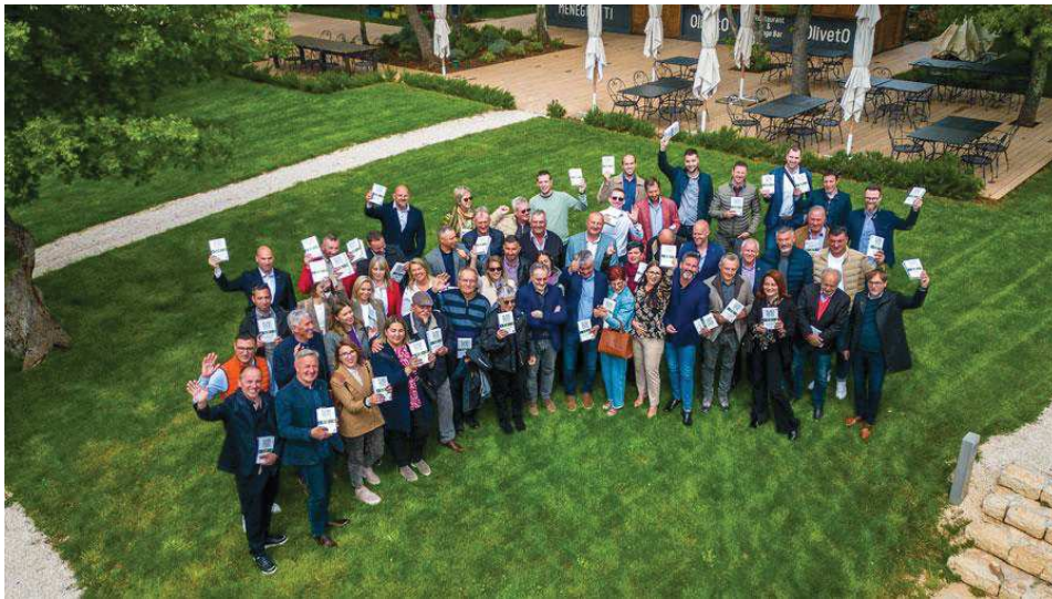
Slika 9. Nagrađeni istarski maslinari na natjecanju Flos Olei 2024

Proizvodnja maslina 2023., uz prosječni prinos od 3 t/ha može se procijeniti na 11,7 tisuća tona, a proizvodnja maslinovog ulja, uz randman od 15% na 1,77 milijuna litara. Za istarsko maslinarstvo još važnije od količine proizvedenog maslinovog ulja je njegova kakvoća. Istarska maslinova ulja redovito postižu vrhunsku kakvoću, što dokazuje visoki broj odličja na prestižnim svjetskim ocjenjivanjima poput Flos Olei-a, na kojemu je Istra zadnjih nekoliko godina najnagrađivanija svjetska regija, ali i premijske cijene koja takva ulja postižu na domaćem i vanjskim tržištima.