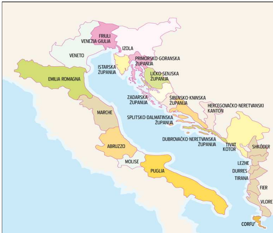
Zemljopisni prikaz Jadranske euoregije