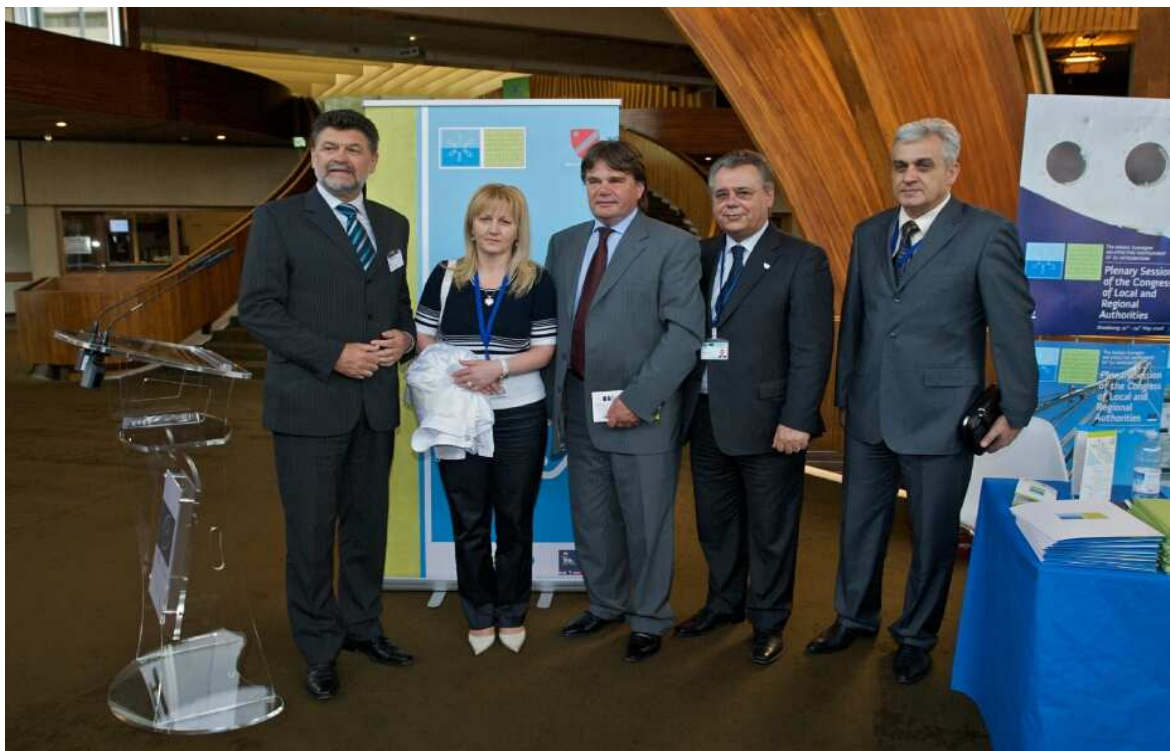
Strasbourg, 29. svibnja 2008.

Za vrijeme trajanja plenarne sjednice u Vijeću Europe bio je izloženi pult asocijacije kako bi se povećala vidljivost Jadranske euroregije. Zatvaranje pulta održano je 29. svibnja uz degustaciju tipičnih proizvoda s Jadranskog područja. Događaj je bio uveličan prisutnošću Glavnog Tajnika Kongresa Urlicha Bonnera i novog predsjednika Kongresa lokalnih i regionalnih vlasti gospodina Yavuz Mildona .