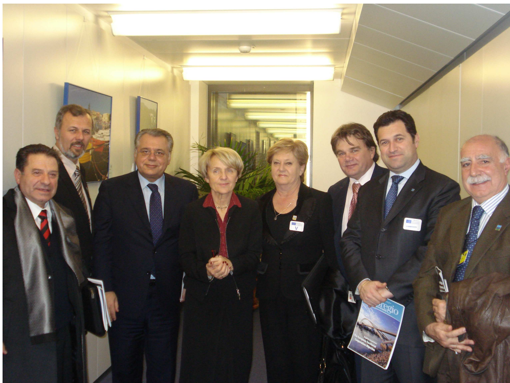
Bruxelles, 22. siječnja 2008.

Dana 22. siječnja 2008. godine predsjednik Jakovčić, potpredsjednik Iorio, te članovi Izvršnog odbora Jadranske euroregije – susreli su se sa povjerenicom Europske Komisije za regionalna pitanja gđ.om Danutom Hübner u Bruxellesu. Tom je prigodom povjerenici predstavljen dosadašnji rad Jadranske euroregije i njezin značaj u stvaranju uzajamne suradnje, mira, stabilnosti i tolerancije. Također su prezentirani projekti koji će se natjecati za sredstva iz europskih fondova, a obuhvaćaju kulturu i turizam, transport i infrastrukturu, zaštitu okoliša, ribarstvo i proizvodne aktivnosti sukladno istoimenim komisijama koje djeluju u sklopu Jadranske euroregije. Povjerenica Hübner uvažila je činjenicu da je Jadranska euroregija politički važan instrument za integraciju zemalja jugoistočne Europe u Europsku Uniju, te organizacija koja podupire europske ciljeve na području Jadrana. Uloga Jadranske euroregije vrlo je važna u europskom kontekstu, stoga je povjerenica Hübner istaknula da će povećati vidljivost udruge, te je uključiti u brojna događanja vezana uz europsku regionalnu politiku.