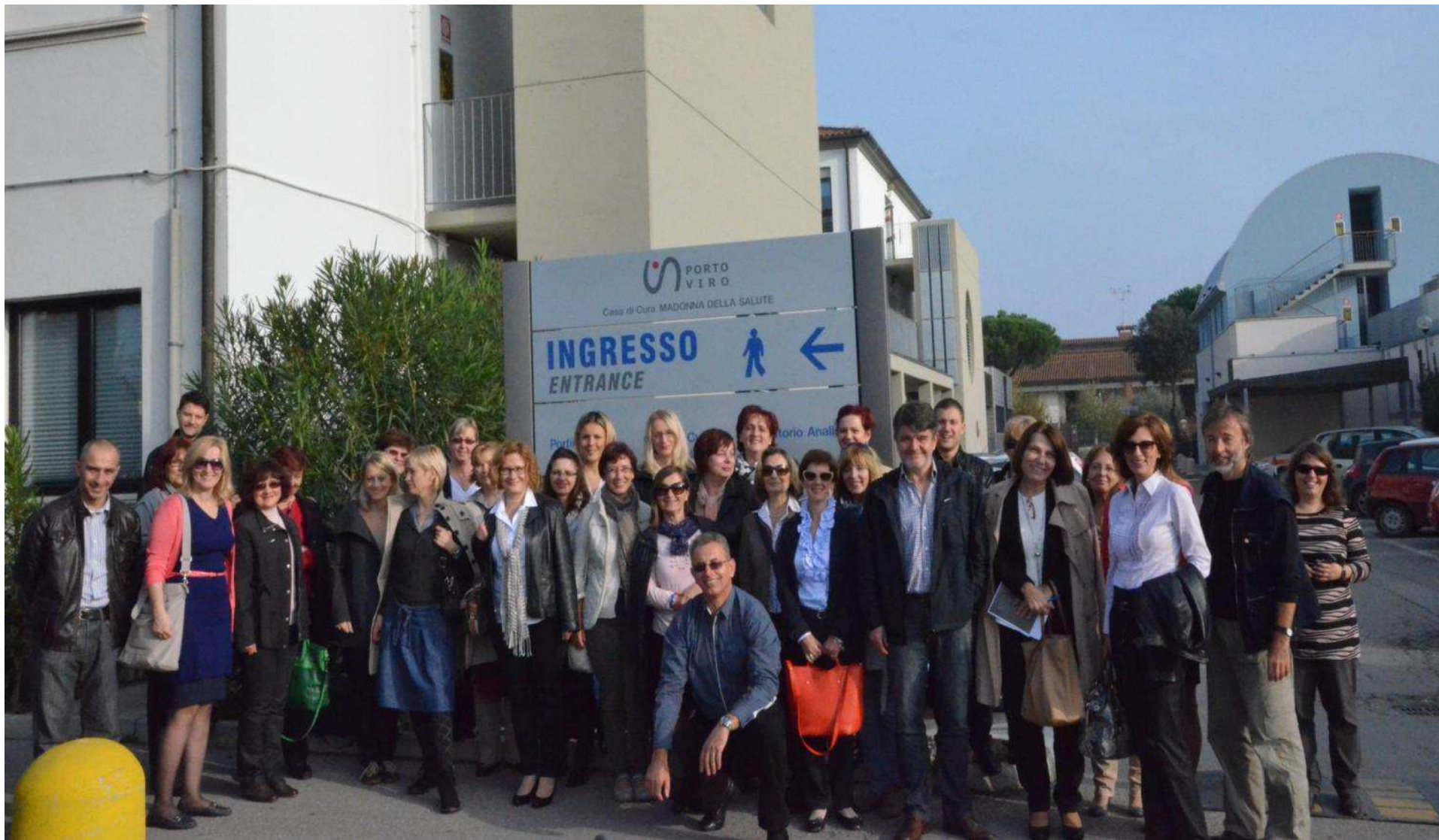
(Casa di Cura Madonna della salute Porto Viro, 15 maggio 2013)