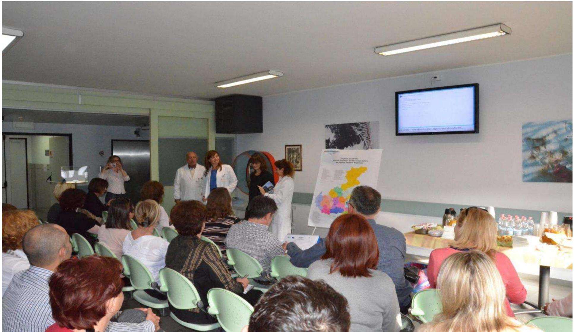
(Casa di Cura Madonna della salute Porto Viro, 15 maggio 2013)