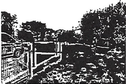
Mjesto gdje bi prema natpisu trebalo biti dječje igralište

UMAG » Kako je moguće da se u Zagrebačkoj ulici na Punt i Umagu nalazi tabla na kojoj piše »dječje igralište«, a na tom mjestu dječjeg igrališta - nema, upitao je jedan stanovnik Umaga, koji nam se obratio i kojega je zasmatelo to što tabla ne pokazuje pravo stanje stvari. Uputili smo pitanje i nadležnima u Gradu Umagu koji su pojasnili situaciju. Naime, »u tljeku je uređenje cijele zone na Punt i, točnije maknule su se stare i dotrajale sprave te je u planu do sezone postaviti potpuno novo«, odgovaraju iz Umaga. Tabla tako ne pokazuje trenutno, već buduće stanje. (J. Mi.)