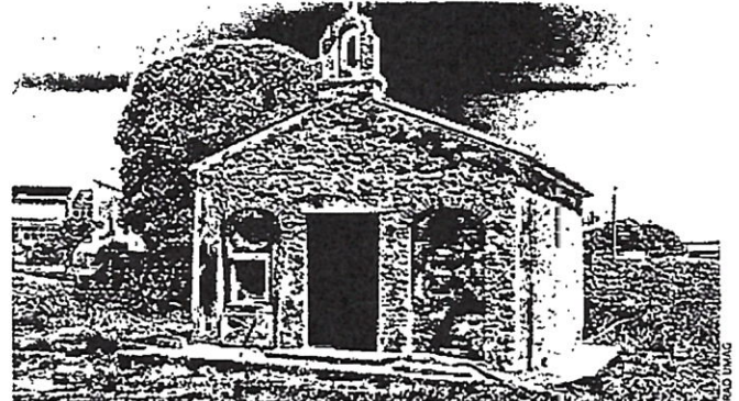
Od 2010. groblje s crkvom sv. Andrije registrirano je kao pojedinačno kulturno dobro

Investiciju su omogućili Grad Umag, Università Popolare di Trieste te regija Veneto. Vrijedna je oko 81.250 eura, a uključuje pripremu radova koji su prethodili samoj rekonstrukciji, istraživački i konzervatorski rad, skidanje postojeće žbuke, čišćenje zidova crkve, demontažu srušenih dijelova zidova, uklanjanje nestabilnih dijelova poda, iskopje i temelje popraćene arheološkim nadzorom, armirano-betonske radove, hidroizolaciju i drenažu te sanaciju obodnog zida groblja, obnovu postojećih kamenih zidova crkve, izradu kamenih okvira vrata i prozora, injektiranje u pukotine te rekonstrukciju kamenog vijenca. Radove je izveo Kapitel d.o.o., gospodarski subjekt ovlašten za izvođenje